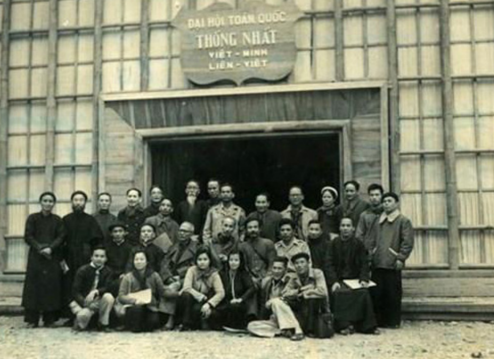
Chủ tịch Hồ Chí Minh và Phó Trưởng ban Thường trực Quốc hội Tôn Đức Thắng chụp ảnh kỷ niệm với các đại biểu dự Đại hội toàn quốc thống nhất Việt Minh - Liên Việt.

tay sai Ngô Đình Diệm, ngày 20/12/1960, Mặt Trận Dân tộc giải phóng miền Nam Việt Nam ra đời và Liên minh Các lực lượng dân tộc, dân chủ và hòa bình Việt Nam được thành lập ngày 20/4/1968 đã tập hợp rộng rãi các tầng lớp, giai cấp, tôn giáo, dân tộc và mọi người dân yêu nước.