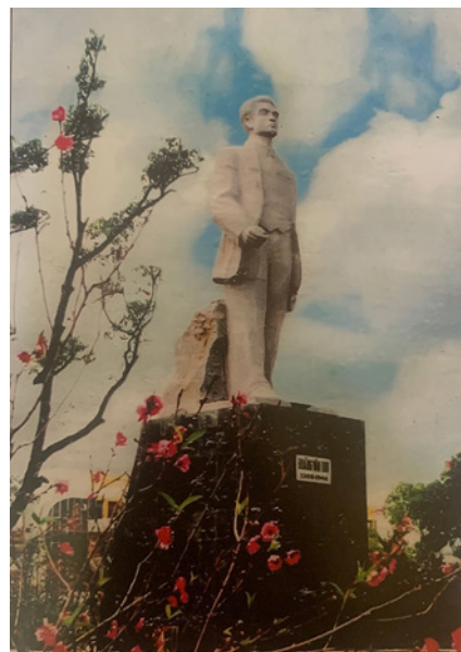
Tượng đài đồng chí Hoàng Văn Thụ tại thành phố Lạng Sơn, tỉnh Lạng Sơn.

Ngày 25/8/1943, đồng chí Hoàng Văn Thụ bị địch bắt, giam cầm, tra tấn hết sức dã man, bị khép tội tử hình, nhưng chúng không lay chuyển được tấm lòng yêu nước, trung thành tuyệt đối với cách mạng của đồng chí. Đồng chí đã thực hiện xuất sắc chủ trương của Đảng “biến nhà tù đế quốc thành trường học cách mạng”. Trong xà lim, án chém, biết mình không qua khỏi dưới mũi súng quân thù, nhưng đồng chí vẫn tìm mọi cách hiến dâng những giờ phút còn lại của cuộc đời cho cách mạng: “ Anh trau dồi lý luận cách mạng, kinh nghiệm đấu tranh và đạo đức cộng sản cho các đồng chí ở gần anh. Anh mở cuộc tranh luận với một số thủ lĩnh Đại Việt ở trong tù làm cho họ thấy được chủ