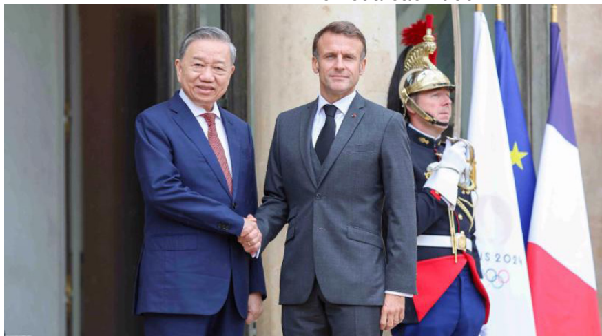
Tổng Bí thư, Chủ tịch nước Tô Lâm và Tổng thống Pháp Emmanuel Macron.

Nhận lời mời của Tổng thống Mông Cổ Ukhnaagiin Khurelsukh, Tổng thống Ireland Michael D. Higgins và Tổng thống Cộng hòa Pháp Emmanuel Macron, Tổng Bí thư, Chủ tịch nước Tô Lâm cùng Đoàn đại biểu cấp cao Việt Nam có các chuyến thăm cấp Nhà nước tới Mông Cổ, Ireland, tham dự Hội nghị cấp cao Pháp ngữ lần thứ 19 và thăm chính thức Cộng hòa Pháp (từ ngày 30/9 - 07/10/2024).