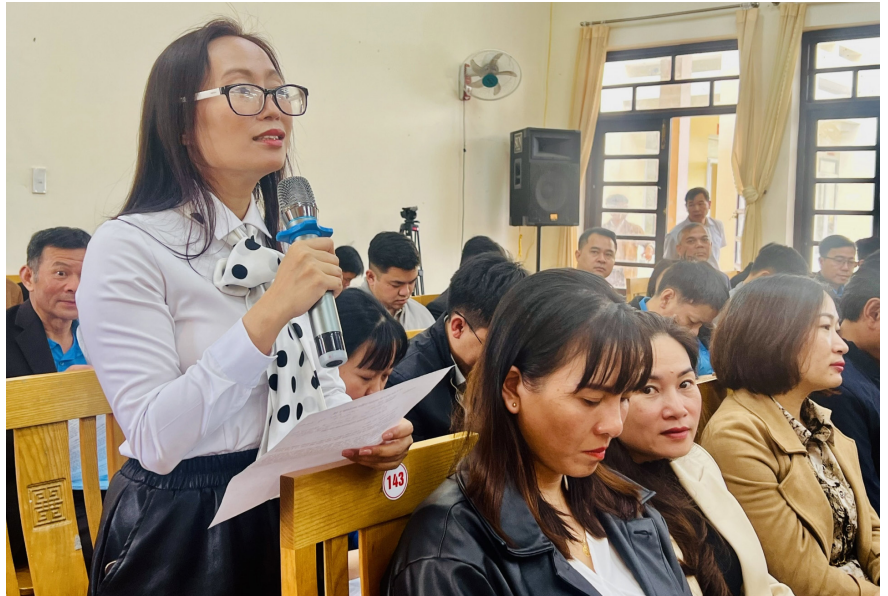
Cử tri phát biểu ý kiến tại buổi tiếp xúc với ĐBQH tỉnh Lâm Đồng.

Cử tri đề nghị Quốc hội, Nhà nước có những chính sách mạnh mẽ hơn nữa trong việc chăm lo, hỗ trợ doanh nghiệp, hỗ trợ Nhân dân vùng bị ảnh hưởng nặng nề của thiên tai sớm khôi phục sản xuất và quan tâm hỗ trợ người nghèo,