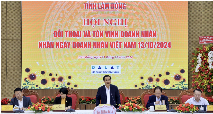
Các đồng chí lãnh đạo tỉnh điều hành Hội nghị đối thoại với doanh nghiệp.

Nhiều doanh nhân trả lời thẳng câu hỏi của Quyền Bí thư Tỉnh ủy về lý do thu hút đầu tư còn hạn chế. Đó là sự thiếu đồng bộ về quy hoạch sử dụng đất, kế hoạch sử dụng đất; quy trình đấu giá tài nguyên khoáng sản cần xem xét lại; thời gian làm thủ tục quá lâu, tính tiền thuê đất theo giá thị trường, khiến doanh nghiệp không đủ