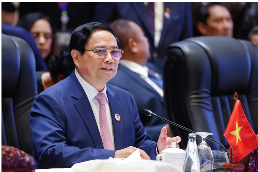
Thủ tướng Chính phủ Phạm Minh Chính phát biểu tại phiên họp toàn thể Hội nghị Cấp cao ASEAN.

Tại Lễ khai mạc, Thủ tướng Lào Sonexay Siphandone nhấn mạnh, hiện khu vực ASEAN và các khu vực khác trên thế giới đang đối mặt với nhiều thách thức, từ xung đột vũ trang cho đến những khó khăn về kinh