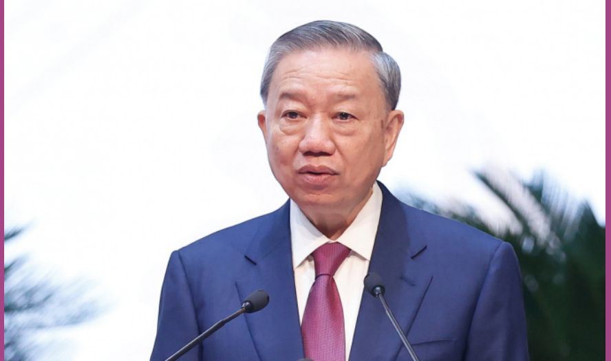
Tổng Bí thư, Chủ tịch nước Tô Lâm.

Sinh thời, Chủ tịch Hồ Chí Minh luôn chú trọng phòng, chống lãng phí. Bác căn dặn “Tham ô, lãng phí và bệnh quan liêu là kẻ thù của nhân dân, của bộ đội và của Chính phủ”; Người chỉ rõ “Tham ô có hại nhưng lãng phí có khi còn hại nhiều hơn: Nó tai hại hơn tham ô vì lãng phí rất phổ biến...”; “Lãng phí tuy không lấy của công dứt túi, song kết quả cũng rất tai hại cho nhân dân, cho Chính phủ. Có khi tai hại hơn nạn tham ô”; Người nhiều lần nhấn mạnh “Phải quý trọng của công: Tất cả cái ăn, cái mặc, cái dùng của các cô, các chú là mồ hôi nước mắt của đồng bào. Phải tiết kiệm, giữ gìn, không được lãng phí; “Tham ô,