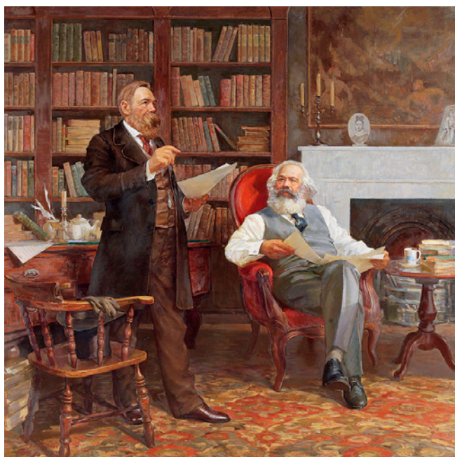
C. Mác và Ph. Ăng-ghen.

Ph.Ăngghen sinh ngày 28/11/1820 tại Bắcmen, tỉnh Rêni của Vương quốc Phổ ( hiện nay là một phần của nước Đức ). Ông là con trai trưởng của một nhà sản xuất sợi dệt giàu có người Đức. Cha ông là một chủ tư bản lớn, rất sùng đạo, tháo vát về kinh doanh, giao du rộng, nhưng về chính kiến thì rất bảo thủ. Mẹ ông là một trí thức kinh tế, nhạy cảm, đôn hậu, hoạt bát, thích hài hước và yêu văn học nghệ thuật.