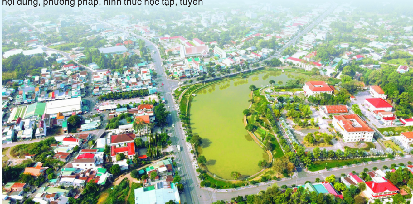
Diện mạo huyện Đạ Huoai ngày càng khang trang, khởi sắc.