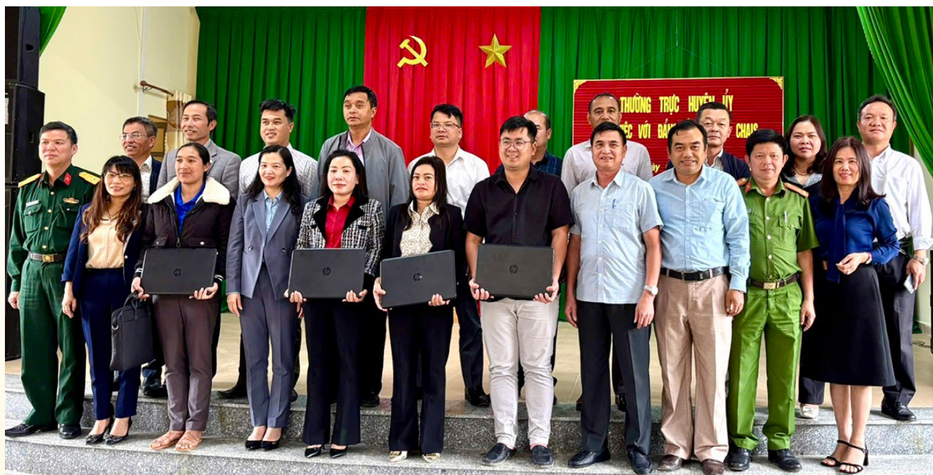
Huyện ủy Lạc Dương hỗ trợ máy tính cho các chi bộ thôn để thực hiện phần mềm “Sổ tay đảng viên điện tử”.

Lạc Dương là địa phương đầu tiên trong tỉnh thực hiện thí điểm phần mềm “Sổ tay đảng viên điện tử”, đây là bước đột phá trong chuyển đổi số hoạt động Đảng, góp phần nâng cao chất lượng sinh hoạt, nâng cao năng lực lãnh đạo, sức chiến đấu của tổ chức Đảng, đảng viên trong toàn Đảng bộ.