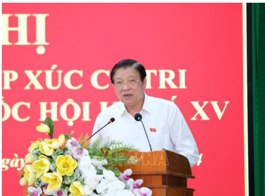
Đồng chí Phan Đình Trạc, Ủy viên Bộ Chính trị, Bí thư Trung ương Đảng, Trưởng Ban Nội chính Trung ương phát biểu tại hội nghị tiếp xúc cử tri xã Ninh Gia, huyện Đức Trọng.