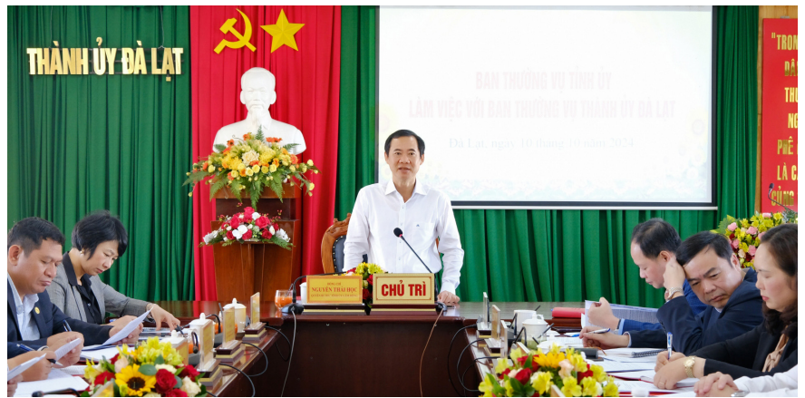
Đồng chí Nguyễn Thái Học - Quyền Bí thư Tỉnh ủy chủ trì buổi làm việc.

Phát biểu tại buổi làm việc, đồng chí Trần Hồng Thái - Chủ tịch UBND tỉnh khẳng định những giá trị rất lớn về cảnh quan và môi trường của TP Đà Lạt. Bên cạnh đó đồng chí cũng đề cập đến những vấn đề mà Đà Lạt cần nỗ lực để cùng với các sở, ngành của tỉnh tìm giải pháp tháo gỡ như: Vấn đề xử lý các điểm có nguy cơ sạt lở trong thành phố; hình thành các khu, điểm kinh doanh chất lượng nhằm tạo động lực phát triển cho thành phố; rà soát lại các dự án đầu tư vào hồ Tuyền Lâm để có định hướng phát triển nhằm khai thác hết những giá trị của khu vực này; thanh tra lại việc cấp phép xây dựng của TP Đà Lạt, nếu có vấn đề sẽ xử lý triệt để để không còn dư luận trong Nhân dân; đẩy mạnh thu ngân sách nhà nước và giải ngân vốn đầu tư công; huy động và sử dụng hiệu quả