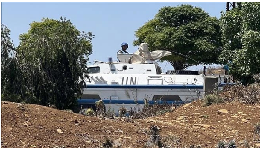
Lực lượng lâm thời của Liên hợp quốc tại Liban (UNIFIL) tuần tra tại biên giới Liban-Israel ở Marjayoun.

Căng thẳng giữa Israel và Hezbollah đã leo thang lên mức độ nguy hiểm thời gian qua khi Israel tiến hành không kích khiến thủ lĩnh Hezbollah thiệt mạng đồng thời đưa binh sĩ vào miền Nam Li-băng. Sự kiện trên tiếp nối chuỗi các đợt tấn công của Israel nhằm vào Dải Gaza, Bờ Tây và Li-băng. Không chỉ tại Dải Gaza, Israel