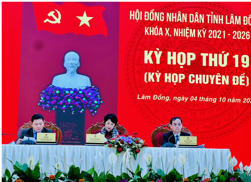
Chủ tọa điều hành Kỳ họp.

Tuy nhiên, việc triển khai thực hiện nhiệm vụ trong điều kiện có những khó khăn, thách thức do nền kinh tế tăng trưởng thấp, tình hình thiên tai diễn biến phức tạp, chi phí đầu vào cho sản xuất tăng cao, chi phí vận chuyển tăng ảnh hưởng rất lớn đến đời sống và sản xuất của người dân, công tác giải ngân vốn đầu tư công tỷ lệ đạt thấp, thu ngân sách chưa đạt kế hoạch; công tác thu hút đầu tư không đạt yêu cầu; chưa kịp thời tháo gỡ trong việc chống lấn các quy hoạch. Đời sống một bộ phận người dân còn khó khăn, nhất là ở vùng sâu, vùng xa, vùng đồng bào dân tộc thiểu số.