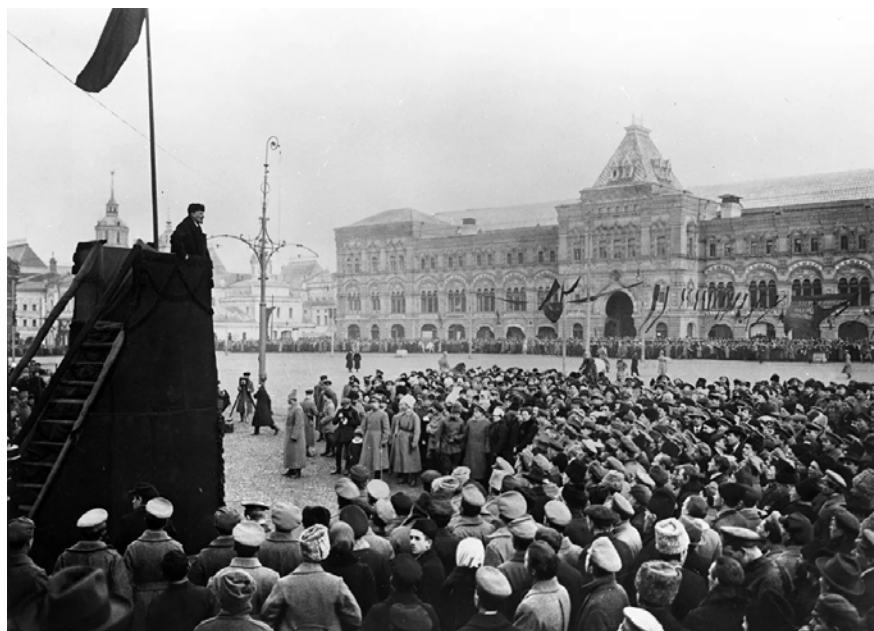
V.I. Lê-nin đọc diễn văn tại Quảng trường Đỏ ở Moskva trong Lễ kỷ niệm một năm ngày Cách mạng Tháng Mười Nga thành công, ngày 07/11/1918.

Từ đó, Người chỉ rõ, việc cần kíp trước hết mà cách mạng đòi hỏi đó là “ phải có Đảng cách mệnh ”; “ Đảng có vững thì cách mạng mới thành công... Đảng muốn vững thì phải có chủ nghĩa làm cốt ”. Người đã kiên trì nghiên cứu, học tập, vận dụng sáng tạo và từng bước truyền bá chủ nghĩa Mác - Lênin về Việt Nam, dày công chuẩn bị những điều kiện cần thiết cho việc thành lập một đảng cách mạng chân chính. Ngày 03/02/1930, Hội nghị hợp nhất các tổ chức cộng sản họp