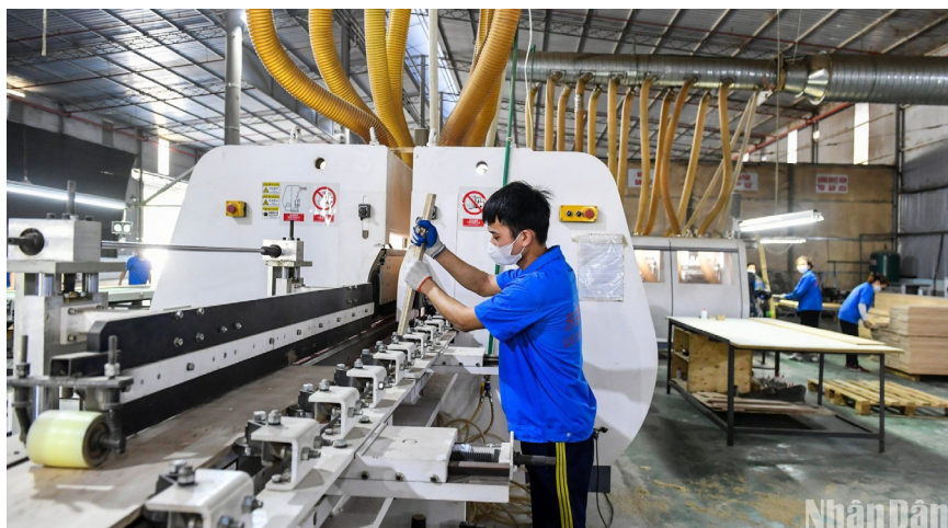
Kinh tế 9 tháng năm 2024 đạt mức tăng trưởng tích cực 6,82%.