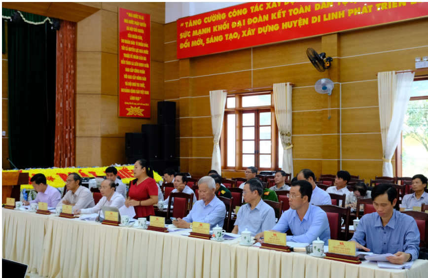
Các đồng chí trong Ban Thường vụ Huyện ủy Di Linh tham gia buổi làm việc.

dân số đông, đồng bào dân tộc thiểu số chiếm tỷ lệ lớn, có thế mạnh về nông nghiệp,... Điều này vừa là thuận lợi, vừa đặt ra thách thức đối với quá trình lãnh đạo, chỉ đạo và thực hiện các nhiệm vụ chung của địa phương. Ghi nhận và đánh giá cao sự cố gắng, nỗ lực, quyết tâm của Ban Thường vụ Huyện ủy Di Linh trong thực hiện nhiệm vụ thời gian qua, đồng chí Quyền Bí thư Tỉnh ủy cũng đồng thời cho rằng, địa phương vẫn chưa có sự đột phá, chưa có những mô hình nổi bật để phát huy được tiềm năng, lợi thế của địa phương.