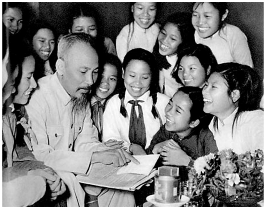
Bác Hồ với học sinh Trường Trưng Vương (Hà Nội) năm 1956.

Cách mạng Tháng Tám năm 1945 thành công, đất nước, xã hội, dân tộc và con người Việt Nam bước vào kỷ nguyên mới, kỷ nguyên độc lập dân tộc gắn liền với chủ nghĩa xã hội. Dân tộc ta, từ kiếp nô lệ lầm than đứng lên làm chủ nước nhà, mở ra tương lai tươi sáng cho thế hệ trẻ. Bác Hồ khẳng định: Cách mạng tháng Tám đã tạo dựng một nền giáo dục mới, khác hẳn về bản chất nền giáo dục nô dịch của thực