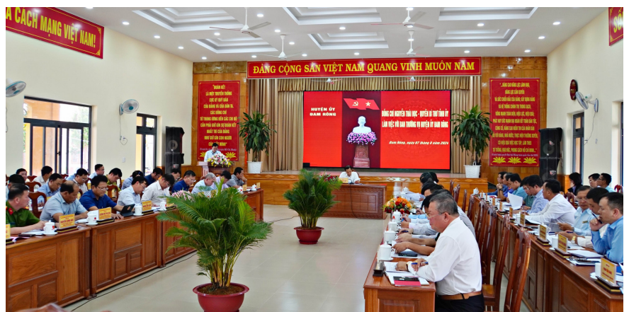
Quang cảnh buổi làm việc.

Đồng thời chất vấn một số ban, ngành liên quan nhằm làm rõ nguyên nhân, trách nhiệm của người đứng đầu để xảy ra sạt lở dẫn đến chết người tại xã Đạ K'nàng vừa qua; công tác quản lý bảo vệ rừng, tỷ lệ độ che phủ rừng thấp; trồng cây phân tán; công tác quản lý bảo vệ tài nguyên, khoáng sản, tình