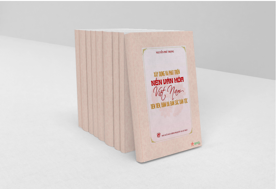
Cuốn sách Xây dựng và phát triển nền văn hóa Việt Nam tiên tiến, đậm đà bản sắc dân tộc của Tổng Bí thư Nguyễn Phú Trọng.

Cuốn sách “Xây dựng và phát triển nền văn hóa Việt Nam tiên tiến, đậm đà bản sắc dân tộc” của Tổng Bí thư Nguyễn Phú Trọng ( sau đây viết tắt là Cuốn sách ) do Ban Tuyên giáo Trung ương chủ trì, phối hợp với Bộ Văn hóa, Thể thao và Du lịch, Nhà xuất bản Chính trị quốc gia Sự thật, Tạp chí Cộng sản, Thông tấn xã Việt Nam và các cơ quan liên quan tổ chức