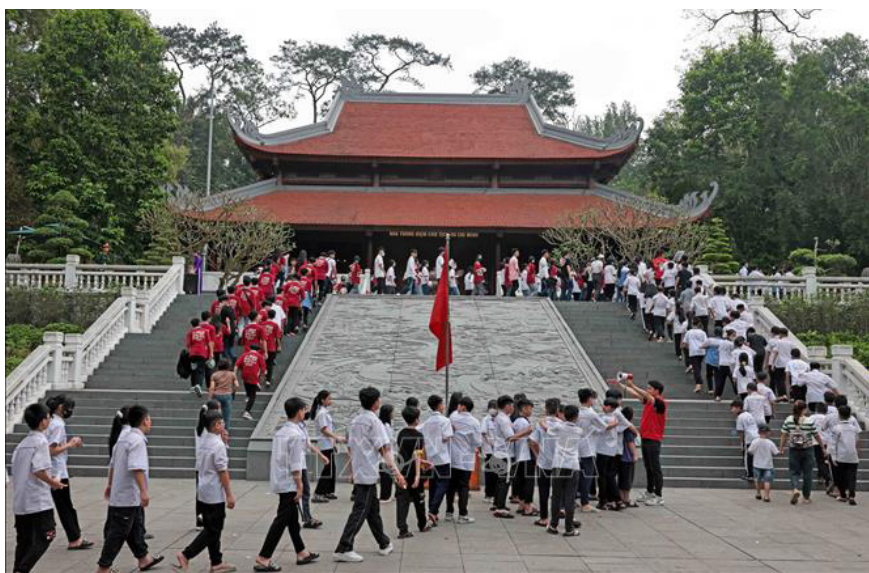
Học sinh Thủ đô Hà Nội và các tỉnh lân cận trước Nhà tưởng niệm Chủ tịch Hồ Chí Minh trong Khu di tích K9.

Sau khi Bác Hồ qua đời ngày 02/9/1969, để phòng chiến tranh có thể xảy ra trên phạm vi cả nước, Bộ Chính trị