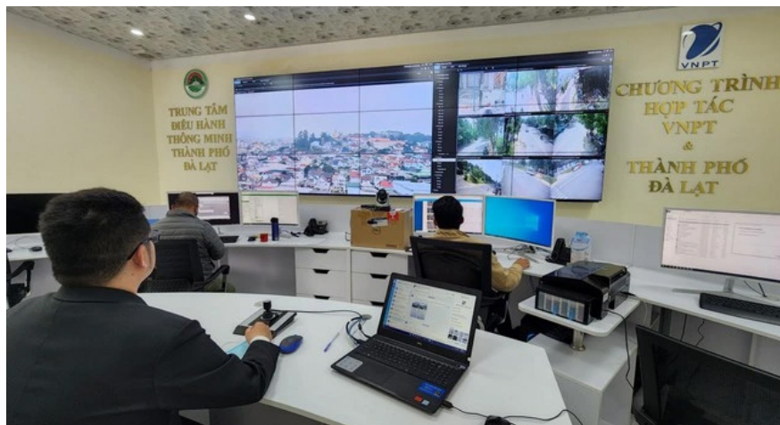
Trung tâm IOC TP Đà Lạt giám sát các hoạt động trật tự xây dựng, giao thông... trên địa bàn.

T rong những năm qua, tỉnh Lâm Đồng luôn chú trọng đến công tác đẩy mạnh ứng dụng công nghệ thông tin, chuyển đổi số. Nghị quyết Đại hội Đảng bộ tỉnh lần thứ XI, nhiệm kỳ 2020 - 2025 đã xác định việc đẩy mạnh ứng dụng công nghệ thông tin (CNTT) là một trong các khâu đột phá; chỉ đạo triển khai Đề án “Xây dựng thành phố Đà Lạt trở thành thành phố thông minh”.