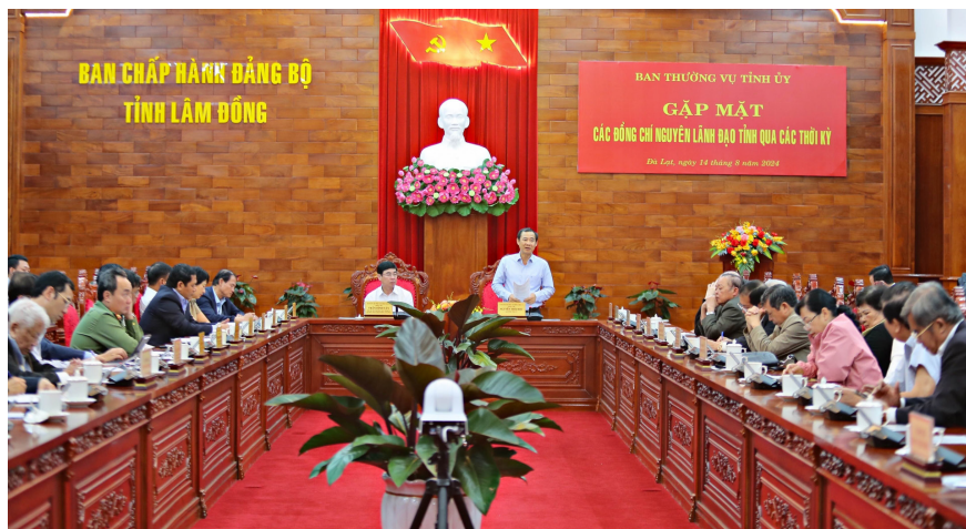
Quang cảnh buổi gặp mặt.

Công tác xây dựng Đảng, hệ thống chính trị có nhiều nỗ lực, cố gắng. Đặc biệt, việc ban hành, quán triệt, triển khai thực hiện nghiêm Chỉ thị số 34-CT/TU của Ban Thường vụ Tỉnh ủy với phương châm “3 điều cần làm” và “4 điều cần tránh” đến tất cả các cấp ủy, tổ chức cơ sở đảng, cán bộ, đảng viên, công chức, viên chức trong toàn Đảng bộ tỉnh mang lại hiệu quả tích cực. Tập trung đổi mới phương thức lãnh đạo của Đảng đối với hệ thống chính trị và đổi mới phương pháp làm việc, đặc biệt là từ cấp ủy tỉnh để lan tỏa đến