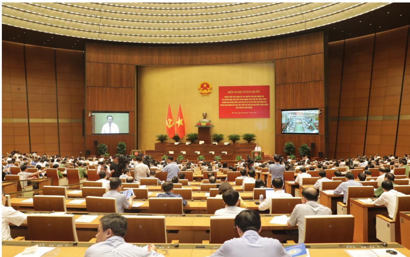
Quang cảnh Hội nghị toàn quốc quán triệt Quy định số 144 và Chỉ thị số 35 tại Hội trường Diên Hồng của Quốc hội.

Q uý định số 144-QĐ/TW, ngày 09/5/2024 của Bộ Chính trị “về chuẩn mực đạo đức cách mạng của cán bộ, đảng viên giai đoạn mới” (Quy định 144) ra đời thực sự là cẩm nang trong xây dựng chuẩn mực đạo đức cách mạng đối với cán bộ, đảng viên.