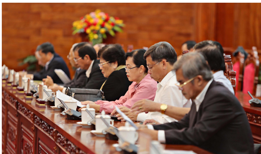
Các đồng chí nguyên lãnh đạo tỉnh qua các thời kỳ tham dự buổi gặp mặt.

Theo đó, trong 7 tháng đầu năm, kinh tế tỉnh Lâm Đồng duy trì đà tăng trưởng; thu ngân sách đạt 8.246 tỷ đồng, bằng 62,99% dự toán Trung ương, bằng 58,28% dự toán địa phương và bằng 107,29 % so với cùng kỳ. Ngành du lịch duy trì tốc độ tăng trưởng