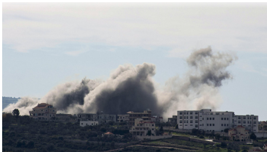
Khói bốc lên từ ngôi làng Tayr Harfa ở phía Nam Lebanon sau một cuộc không kích của Israel.

Trước nguy cơ xảy ra xung đột ở cả khu vực Trung Đông, các nước đang dồn lực chạy đua ngoại giao nhằm ngăn chặn cuộc đối đầu giữa Israel với Hamas và Hezbollah lan rộng. Hội đồng Bảo an Liên hợp quốc đã tổ chức cuộc họp khẩn. Ngoại trưởng Mỹ Antony Blinken đã kêu gọi “tắt cả các bên” chấm dứt hành động leo thang và chấp nhận một lệnh ngừng bắn ở Gaza. Liên đoàn Arab, Trung Quốc, Jordan, Ai Cập... kêu gọi các bên kiềm chế, cảnh báo hậu quả tàn khốc của một cuộc chiến khu vực. Các nước lớn như Trung Quốc, Nga; các nước trong khu vực gồm Iran, Thổ Nhĩ Kỳ, Ai Cập, Qatar, Iraq, Palestine; lực lượng Hamas, Hezbollah, Houthi và các lực lượng kháng chiến tại Iraq đã lên án hành động này. Trước nguy cơ bạo lực lan rộng, nhiều quốc gia, trong đó có Mỹ, Anh, Pháp, Canada, Jordan đã khuyến cáo công dân rời khỏi Lebanon và Iran. Thụy Điển cũng thông báo đóng cửa Đại sứ quán của nước này tại Beirut và kêu gọi công dân rời Lebanon. Nhiều hãng hàng không phương Tây đã đình chỉ các chuyến bay đến khu vực này.