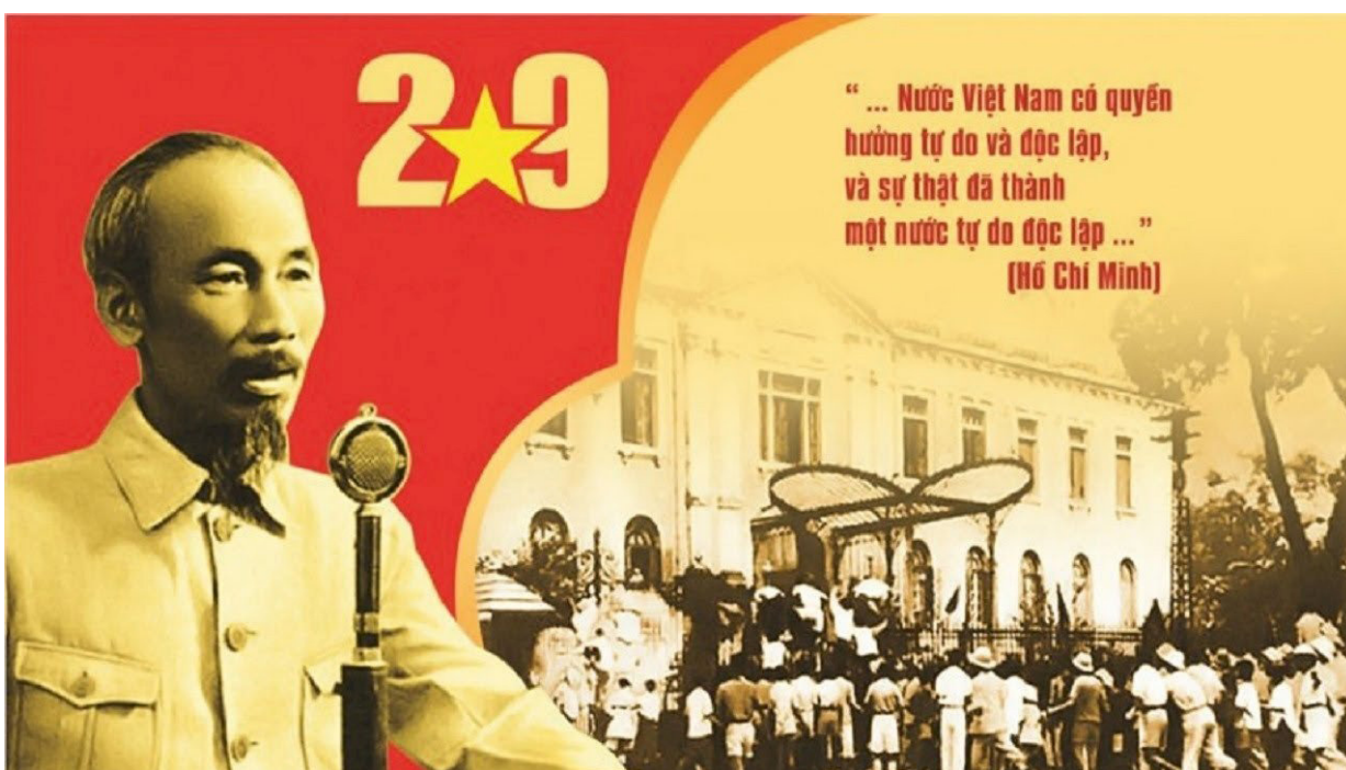
Bác Hồ đọc Bản Tuyên ngôn độc lập tại Quảng trường Ba Đình ngày 2/9/1945.

Ngày 2/9/1945 trở thành mốc son trong lịch sử đấu tranh giành độc lập của dân tộc. Đánh dấu sự ra đời của nước Việt Nam Dân chủ Cộng hòa, nhà nước công - nông đầu tiên ở Đông Nam Á. Từ đây, một kỷ nguyên mới đã mở ra cho dân tộc Việt Nam. Kỷ nguyên độc lập dân tộc gắn liền với chủ nghĩa xã hội.