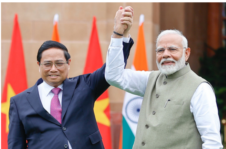
Thủ tướng Phạm Minh Chính và Thủ tướng Ấn Độ Narendra Modi.

thăm, Thủ tướng Chính phủ Phạm Minh Chính hội đàm, tiếp xúc với Lãnh đạo cấp cao Ấn Độ, các tập đoàn lớn của Ấn Độ, phát biểu tại Diễn đàn Doanh nghiệp Việt Nam - Ấn Độ và Hội đồng các vấn đề quốc tế của Ấn Độ. Các cuộc gặp, tiếp xúc của Thủ tướng Chính phủ với Lãnh đạo Ấn Độ khẳng định tình cảm hữu nghị gắn bó và mối quan hệ hữu nghị truyền thống bền chặt giữa hai nước cũng như sự coi trọng và ủng hộ lẫn nhau trong tổng thể chính sách đối ngoại của mỗi nước. Hai bên khẳng định tăng cường hơn nữa quan hệ Đối tác chiến lược toàn diện Việt Nam - Ấn Độ trong các lĩnh vực truyền thống như quốc phòng - an ninh, thương mại - đầu tư, văn hóa - giáo dục và mở rộng những lĩnh vực hợp tác mới về kinh tế xanh, kinh tế số, kinh tế tri thức, gia tăng thương mại và đầu tư hai chiều, đẩy mạnh và làm sâu sắc hợp tác về khoa học - công nghệ; sẵn sàng hợp tác, chung tay xây dựng hòa bình, ổn định, hợp tác và phát triển ở khu vực châu Á - Thái Bình Dương và Ấn Độ Dương.