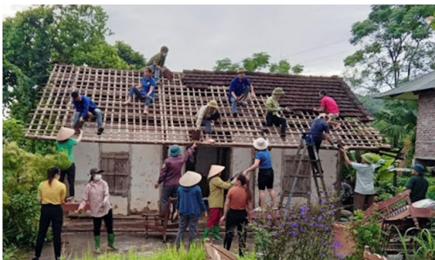
Chung tay xóa nhà tạm, nhà dột nát trên phạm vi cả nước trong năm 2025.

Mặt trận Tổ quốc Việt Nam, tổ chức chính trị - xã hội, tổ chức chính trị - xã hội - nghề nghiệp, tổ chức xã hội - nghề nghiệp, tổ chức xã hội tuyên truyền, vận động đoàn viên, hội viên và Nhân dân hưởng ứng thực hiện Phong trào thi đua, tích cực tham gia đóng góp, ủng hộ giúp đỡ hộ nghèo, hộ cận nghèo xây mới và sửa chữa nhà ở; kêu gọi, vận động các doanh nghiệp, tổ chức kinh tế tích cực tham gia đóng góp, ủng hộ xóa nhà tạm, nhà dột nát nhằm phát huy cao nhất khả năng huy động nguồn lực xã hội hóa từ cộng đồng; tăng cường và phát huy hiệu quả công tác giám sát, phản biện xã hội trong việc thực hiện các chế độ, chính sách xóa nhà tạm, nhà dột nát.