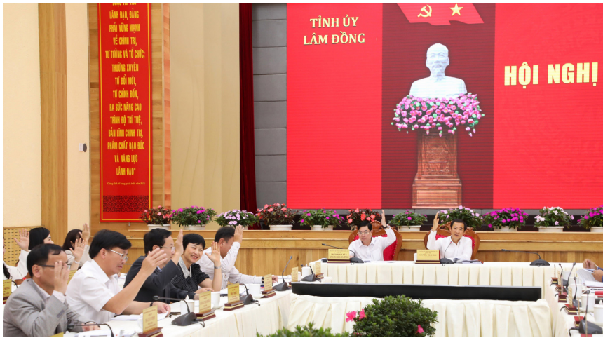
Ban Chấp hành Đảng bộ tỉnh nhất trí cao về chủ trương đầu tư và việc điều chỉnh chủ trương đầu tư lần này.

được Thủ tướng Chính phủ phê duyệt chủ trương đầu tư. Tổng chiều dài của cả hai dự án này là 140km.