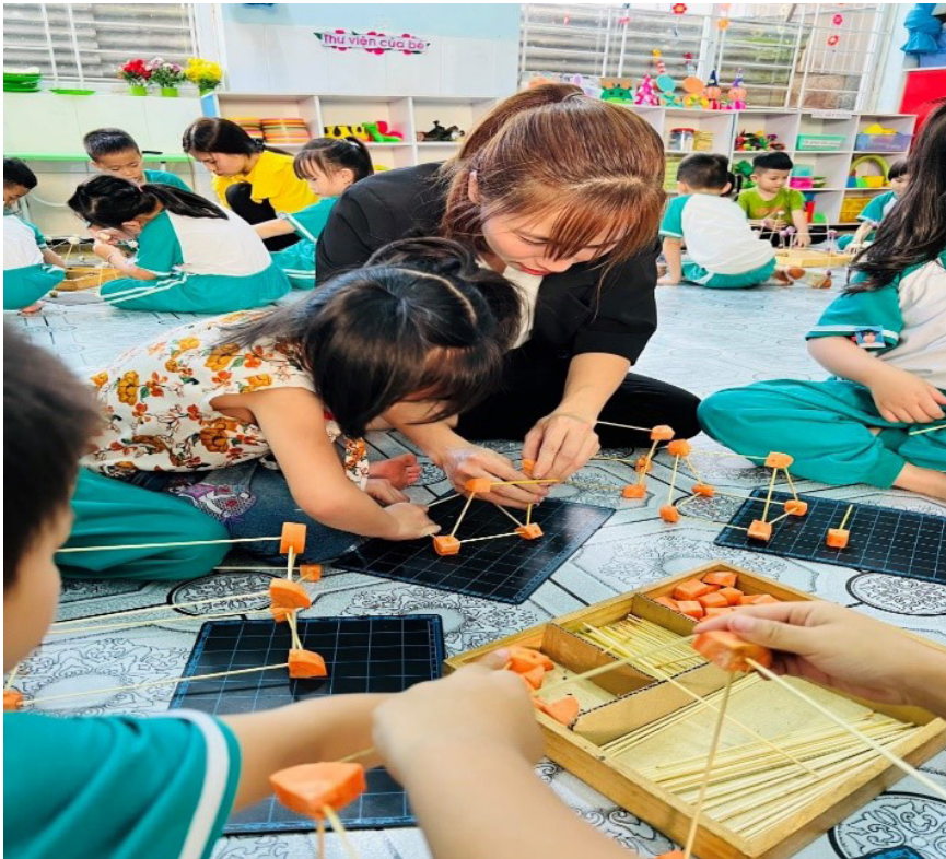
Cô và trò Trường mầm non Đại Lào trong một giờ học.

S inh thời chủ tịch Hồ Chí Minh từng nói: “Trẻ em như búp trên cành/ Biết ăn ngủ, biết học hành là ngoan”.