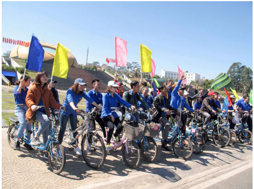
Tuổi trẻ ngành Y tế đạp xe vì sức khỏe Việt Nam tại Quảng trường Lâm viên Đà Lạt.

Dân số già hóa gây ra nhiều thách thức cho tăng trưởng kinh tế cũng như hạ tầng cơ sở và các dịch vụ an sinh xã hội, đặc biệt là ở các khu vực thành thị bởi tỷ trọng người cao tuổi cao hơn so với khu vực nông thôn. Một trong những nguyên nhân dẫn đến