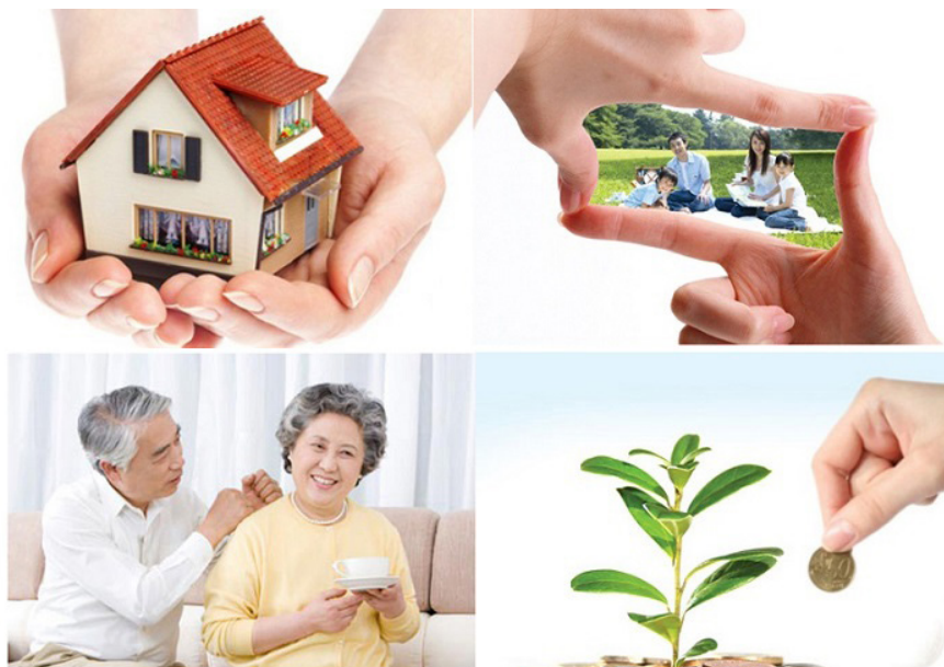
Nghị định số 21/2023/NĐ-CP ngày 5/5/2023 quy định về bảo hiểm vi mô.

Số tiền bảo hiểm của từng hợp đồng bảo hiểm của sản phẩm bảo hiểm vi mô bảo vệ các rủi ro về tính mạng và sức khỏe không vượt quá 05 lần thu nhập bình quân đầu người hàng năm của chuẩn hộ cận nghèo ở khu vực thành thị theo quy định của Chính phủ tại thời điểm triển khai sản phẩm. Số tiền bảo hiểm của từng hợp đồng bảo hiểm của sản phẩm bảo hiểm vi mô bảo vệ các rủi ro về tài sản không vượt quá giá trị thị trường của tài sản được bảo hiểm tại thời điểm tham gia bảo hiểm và không vượt quá 05 lần thu nhập