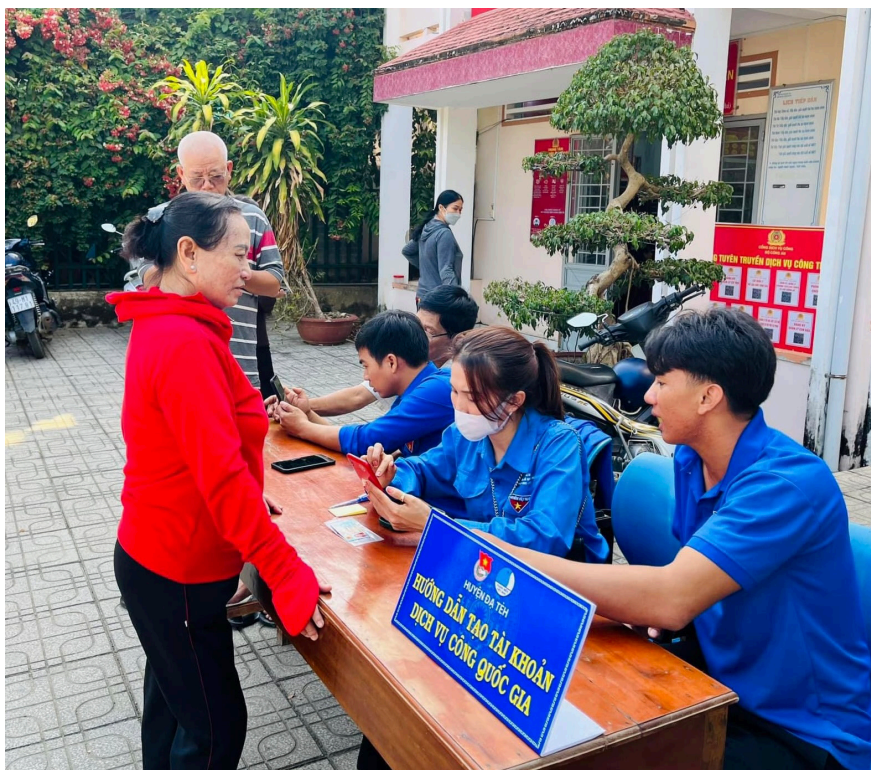
Đoàn viên, thành niên Lâm Đồng luôn xung kích trong tuyên truyền, vận động, hướng dẫn người dân thực hiện chuyển đổi số.

Để thích ứng linh hoạt với tình hình phức tạp của dịch Covid-19, Ban Thường vụ Tỉnh Đoàn đã chỉ đạo các cấp bộ Đoàn trong toàn tỉnh đổi mới hình thức tuyên truyền từ trực tiếp sang trực tuyến. Thông qua trang thông tin điện tử,