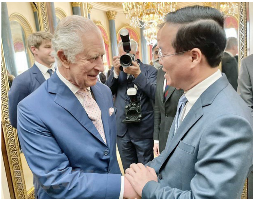
Chủ tịch nước Võ Văn Thưởng và Nhà vua Anh Charles III.

Chuyến đi của Chủ tịch nước Võ Văn Thưởng diễn ra trong bối cảnh hai nước kỷ niệm 50 năm thiết lập quan hệ ngoại giao. Đây là hoạt động đối ngoại cấp cao có ý nghĩa