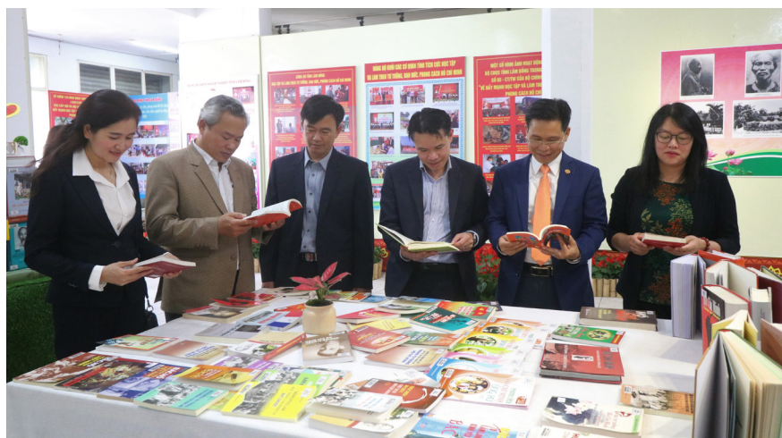
Gần 100 đầu sách về cuộc đời, sự nghiệp, tư tưởng Hồ Chí Minh được trưng bày tại triển lãm.