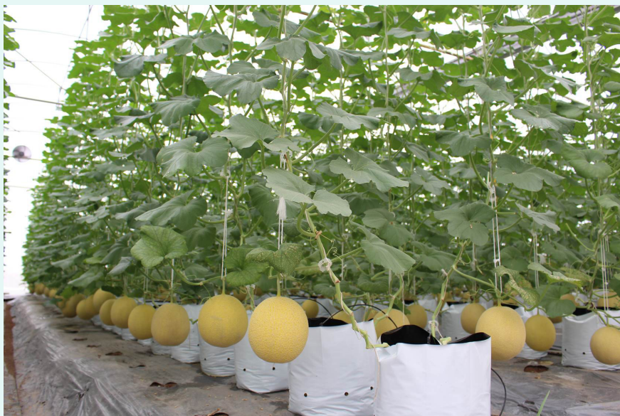
Sản xuất nông nghiệp ứng dụng công nghệ cao ở Lâm Đồng đã mang lại hiệu quả kinh tế.

Văn kiện Đại hội XIII tiếp tục đề cập đến nội dung trên, nhưng nhấn mạnh mô hình tăng trưởng mới cần tận dụng tốt cơ hội của cuộc Cách mạng công nghiệp lần thứ tư, dựa trên tiến bộ khoa học và công nghệ, đổi mới sáng tạo. Cụ thể là: “Tiếp tục đẩy mạnh đổi mới mô hình tăng trưởng kinh tế, chuyển mạnh nền kinh tế sang mô hình tăng trưởng