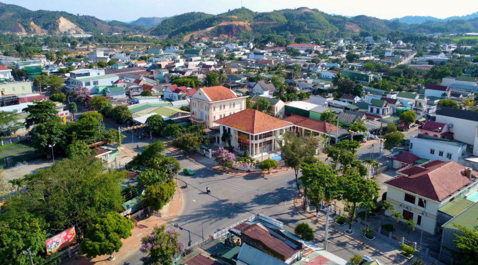
Theo kết luận Hội nghị Ban Thường vụ Tỉnh ủy lần thứ 44, 3 huyện Đạ Huoai, Đạ Tẻh và Cát Tiên sẽ sáp nhập thành 1 đơn vị hành chính cấp huyện giai đoạn 2023-2025. Trong ảnh. Trung tâm huyện Đạ Tẻh

4. Sơ kết, tổng kết việc thực hiện mô hình thí điểm bí thư cấp ủy đồng thời là chủ tịch ủy ban nhân dân cấp xã; thực hiện chức danh bí thư cấp ủy đồng thời là chủ tịch hội đồng nhân dân ở cấp tỉnh, cấp huyện, cấp xã ( Ban Tổ chức Tỉnh ủy, Ban cán sự đảng UBND tỉnh, Đảng đoàn HĐND tỉnh tham mưu, chỉ đạo thực hiện theo kế hoạch của Trung ương ).