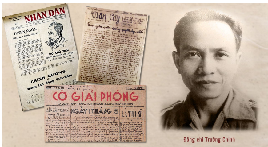
Đồng chí Trường Chinh và một số tờ báo do đồng chí sáng lập, tổ chức, chỉ đạo.

Nhân kỉ niệm 98 năm ngày Báo chí cách mạng Việt Nam (21/6/1925-21/6/2023), chúng ta nhìn lại chặng đường hoạt động cách mạng và làm báo của Nhà báo lớn Trường Chinh.