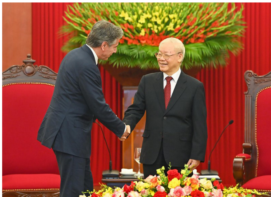
Tổng Bí thư Nguyễn Phú Trọng chào mừng Bộ trưởng Ngoại giao Hoa Kỳ Antony Blinken thăm Việt Nam.

Nhận lời mời của Bộ trưởng Ngoại giao Bùi Thanh Sơn, Ngoại trưởng Hoa Kỳ Anthony Blinken thăm Việt Nam từ ngày 14 - 16/4/2023. Đây là chuyến thăm Việt Nam đầu tiên của ông Antony Blinken trên cương vị Ngoại trưởng Hoa Kỳ.