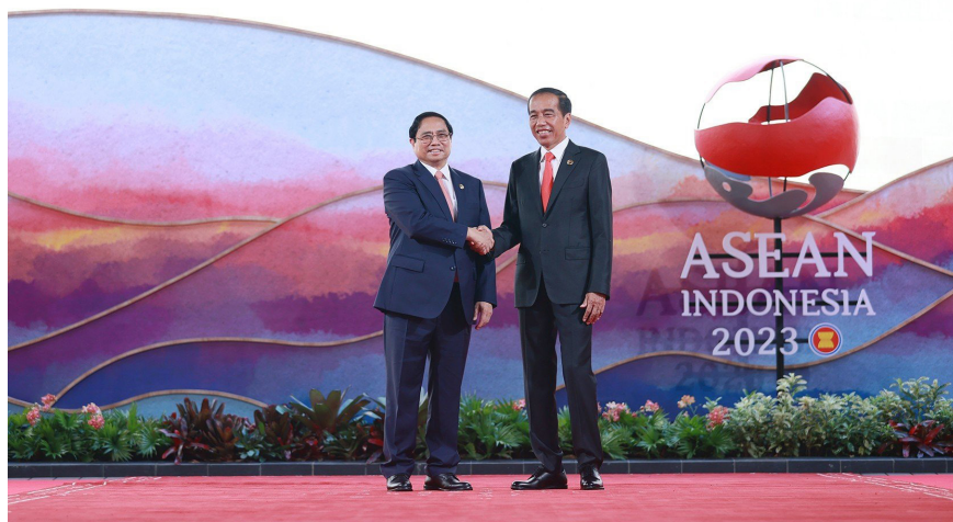
Tổng thống Indonesia Joko Widodo chào đón Thủ tướng Phạm Minh Chính dự Hội nghị Cấp cao ASEAN.

Trong khuôn khổ chuyến thăm Việt Nam, Ngoại trưởng Mỹ Blinken đã dự lễ khởi công khu phức hợp Đại sứ quán Mỹ tại Hà Nội. Đây được coi là “biểu tượng mới cho quan hệ hai nước”. Việc hai nước đạt Thỏa thuận về các điều kiện