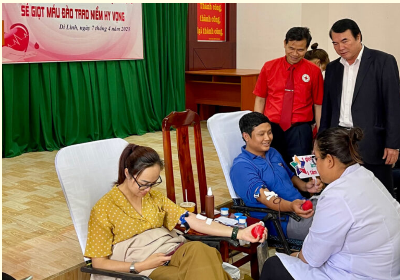
Lãnh đạo tỉnh và Hội Chữ thập đỏ tỉnh thăm hỏi, động viên người hiến máu tình nguyện.

Máu là một loại được phẩm quý, chỉ có được từ người hiến máu, không thể sản xuất và không có hóa chất nào có thể thay thế được. Máu được dùng để truyền cho người bệnh mất máu cấp và thiếu máu mạn tính. Nếu không có máu để truyền kịp thời, người bệnh thiếu máu sẽ không giữ được nhịp đập của trái tim.