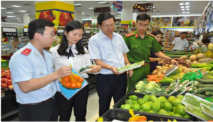
Tăng cường bảo đảm an ninh, an toàn thực phẩm trong tình hình mới.

thức và hành động, đề cao trách nhiệm người đứng đầu cơ quan có liên quan và địa phương đối với công tác đảm bảo an ninh, an toàn thực phẩm, tăng cường hiệu lực, hiệu quả quản lý nhà nước, xây dựng cơ chế, chính sách và bố trí nguồn nhân lực cho công tác đảm bảo an ninh, an toàn thực phẩm đáp ứng yêu cầu phát triển và hội nhập; phát huy các kết quả đạt được trong công tác bảo đảm an toàn thực phẩm, nâng cao nhận thức của cán bộ, công chức, viên chức và nhân dân về tầm quan trọng sống còn đối với sức khỏe, hạnh phúc của từng người dân, giống nòi dân tộc và sự phát triển của đất nước; từng bước khắc phục những hạn chế, bất cập cả về thể chế và thực thi pháp luật của công tác quản lý nhà nước về an toàn thực phẩm; bảo đảm an ninh, an toàn thực phẩm trong thời gian tới, Kế hoạch triển khai thực hiện Chỉ thị số 17-CT/TW (được phê duyệt bởi Quyết định số 426/QĐ-TTg, ngày 21/4/2023 của Thủ tướng Chính phủ) yêu cầu các bộ, cơ quan ngang bộ, cơ quan thuộc