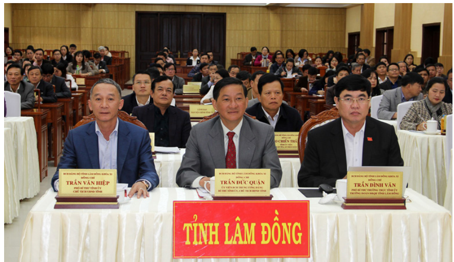
Các đồng chí Thường trực Tỉnh ủy dự Hội nghị toàn quốc nghiên cứu, học tập, quán triệt, Nghị quyết Hội nghị lần thứ 6, Ban Chấp hành Trung ương Đảng khóa XIII tại điểm cầu Lâm Đồng.

Nhằm kịp thời triển khai Chỉ thị 23-CT/TW trong toàn tỉnh, Ban Thường vụ Tỉnh ủy đã ban hành Kế hoạch số 46-KH/TU ngày 03/4/2018; đồng thời, chỉ đạo Ban Tuyên giáo Tỉnh ủy hướng dẫn học tập, quán triệt trong cán bộ, đảng viên và tuyên truyền trong Nhân dân về nội dung cốt lõi của Chỉ thị 23-CT/TW và Kế hoạch 46-KH/TU. Qua đó, toàn tỉnh đã tổ chức 198 hội nghị cho 29.147 cán bộ, đảng