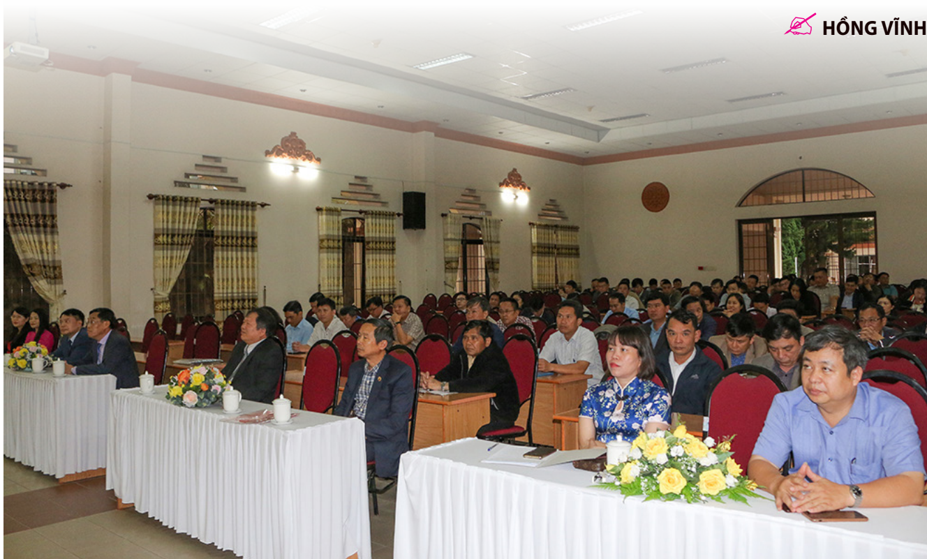
Các đại biểu và học viên tham dự khai giảng lớp Bồi dưỡng lãnh đạo, quản lý cấp sở, cấp huyện năm 2023.

N hận thức rõ vai trò, ý nghĩa, tầm quan trọng của bồi dưỡng, cập nhật kiến thức đối với cán bộ lãnh đạo, quản lý các cấp, những năm qua Tỉnh ủy, Ban Thường vụ Tỉnh ủy luôn quan tâm, chỉ đạo việc triển khai thực hiện Quy định số 164-QĐ/TW, ngày 01/02/2013