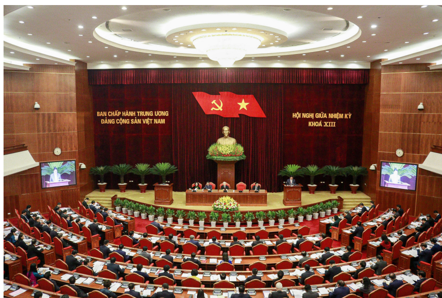
Hội nghị giữa nhiệm kỳ Ban Chấp hành Trung ương Đảng khóa XIII.

Hội nghị giữa nhiệm kỳ Ban chấp hành Trung ương Đảng khóa XIII (từ ngày 15/5 đến 17/5/2023) đã diễn ra thành công tốt đẹp. Một trong những nội dung quan trọng của Hội nghị lần này là Ban chấp hành Trung ương tổ chức lấy phiếu tín nhiệm đối với các đồng chí Ủy viên Bộ Chính trị, Ủy viên Ban Bí thư khóa XIII. Đây là việc làm cần thiết nhằm không ngừng nâng cao năng lực lãnh đạo, sức chiến đấu của Đảng, đồng thời góp phần đánh giá thực chất chất lượng, hiệu quả công tác của đội ngũ cán bộ lãnh đạo cấp cao của Đảng. Phát biểu tại Hội nghị, Tổng Bí thư Nguyễn Phú Trọng nêu rõ mục đích lấy phiếu tín nhiệm là để thực hiện tốt hơn, hiệu quả hơn các chủ trương, đường lối, nghị quyết, kết luận của Ban Chấp hành Trung ương Đảng về xây dựng, chỉnh đốn Đảng và hệ thống chính trị trong sạch, vững mạnh toàn diện.