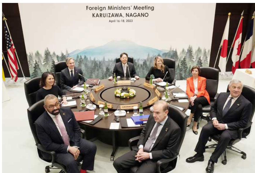
Ngoại trưởng các nước G7 nhóm họp tại Nhật Bản.

Vừa qua, Ngoại trưởng Nhóm các nước có nền công nghiệp phát triển hàng đầu thế giới (G7) đã họp tại tỉnh Nagano, miền Trung Nhật Bản và thảo luận nhiều vấn đề quốc tế quan trọng, trong đó có an ninh châu Âu và khu vực Ấn Độ Dương - Thái Bình Dương. Đây là phiên họp quan trọng để chuẩn bị cho Hội nghị thượng đỉnh các nước G7 do Thủ tướng Nhật Bản Fumio Kishida chủ trì. Hội nghị thượng đỉnh lần thứ 49 của G7 được coi là sự kiện