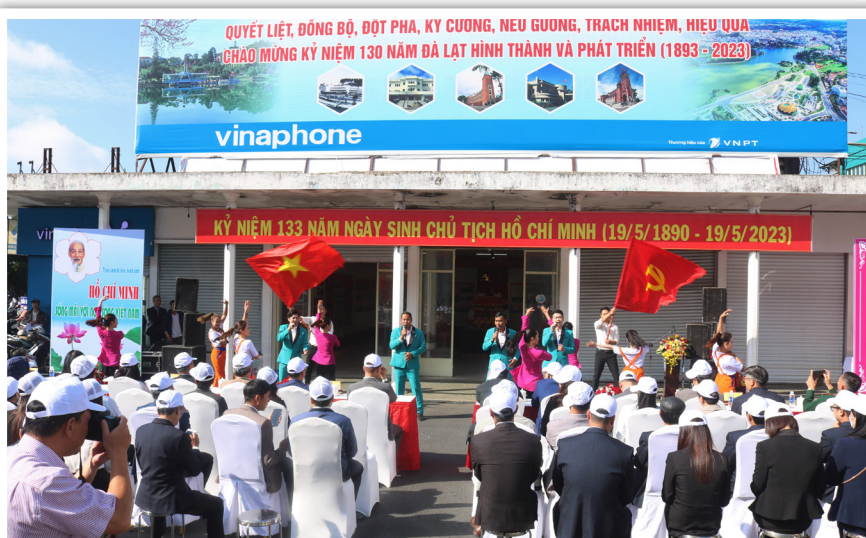
Quang cảnh lễ khai mạc triển lãm.