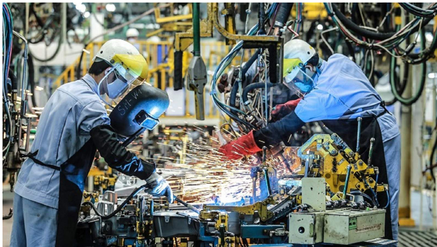
Nghị quyết số 58/NQ-CP ngày 21/4/2023 nêu rõ các giải pháp trọng tâm hỗ trợ doanh nghiệp chủ động thích ứng, phục hồi nhanh và phát triển bền vững đến năm 2025.

Về quan điểm, cần quán triệt thực thi đầy đủ và hiệu