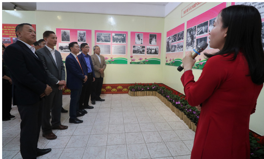
Đại biểu nghe thuyết minh giới thiệu về thân thế, sự nghiệp và cuộc đời hoạt động cách mạng của Chủ tịch Hồ Chí Minh.

Triển lãm đã quy tụ trên 100 bức ảnh, gần 100 đầu sách về thân thế, sự nghiệp, tư tưởng Hồ Chí Minh được sắp xếp theo hành trình con đường cách mạng của Người, từ khi Bác Hồ ra đi tìm đường cứu nước đến khi lãnh đạo Nhân dân Việt Nam khởi nghĩa giành chính quyền năm 1945; kháng chiến chống thực dân Pháp và đế quốc Mỹ để giành