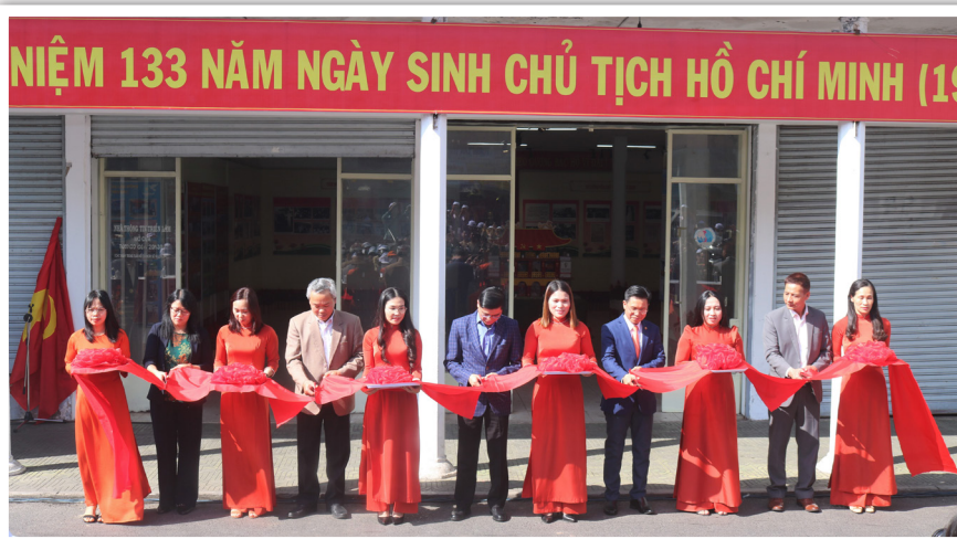
Các đồng chí lãnh đạo tỉnh cắt băng khai mạc triển lãm.