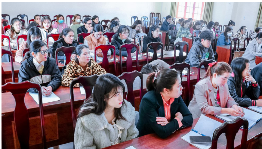
Bồi dưỡng lý luận chính trị cho đối tượng kết nạp Đảng năm 2023 của các TCCS đảng trực thuộc Huyện ủy Lạc Dương.

Nhìn nhận về thực trạng này, Phó Bí thư Thường trực Huyện ủy Lạc Dương Ya Tiong cho biết: “Có nhiều nguyên nhân dẫn đến việc phát triển đảng viên trên địa bàn không đạt chỉ tiêu, trong đó phải thẳng