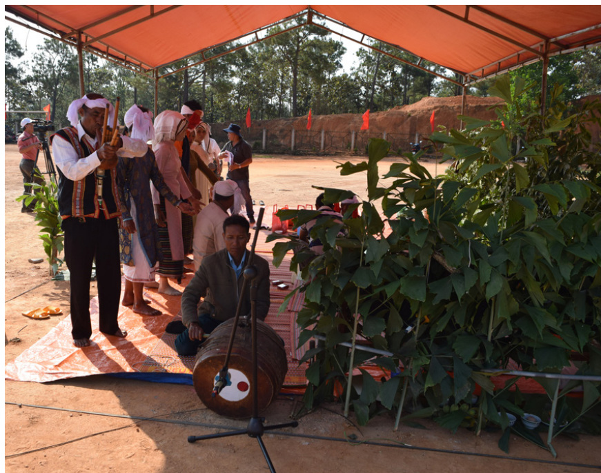
Các nghệ nhân múa công chiêng chào mừng Lễ hội mừng lúa mới của đồng bào Churu tại huyện Đức Trọng.

Phát biểu khai mạc Tuần lễ vàng du lịch Lâm Đồng lần