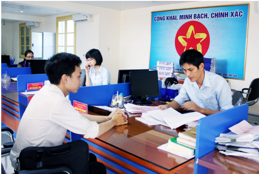
Quý II năm 2023, Bộ Nội vụ triển khai xác định và công bố Chỉ số hài lòng về sự phục vụ hành chính năm 2022.

công trực tuyến được cải thiện. Đơn giản hóa thủ tục hành chính nội bộ gắn với chuyển đổi số, phân cấp trong giải quyết thủ tục hành chính được quan tâm, chỉ đạo tích cực hơn; việc gửi, nhận, xử lý hồ sơ trên môi trường điện tử và chuẩn hóa chế độ báo cáo được đẩy mạnh. Năm 2022, kết quả Chỉ số cải cách hành chính và Chỉ số hài lòng về sự phục vụ hành chính đều đạt trên 80%, cơ bản phản ánh đúng thực trạng triển khai công tác cải cách hành chính tại các bộ, cơ quan, địa phương; trong đó, kết quả đánh giá một số lĩnh vực, tiêu chí đã cho thấy sự cải thiện rõ nét so với năm 2021.