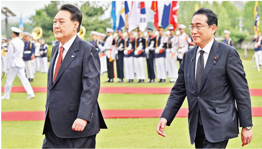
Tổng thống Hàn Quốc và Thủ tướng Nhật Bản tại Seoul.

thống Hàn Quốc Yoon và Thủ tướng Nhật Bản Kishida, trong đó tập trung vào các vấn đề an ninh, thương mại, công nghiệp công nghệ cao, khoa học và công nghệ, hợp tác về các vấn đề văn hóa và thanh niên, vấn đề Triều Tiên.