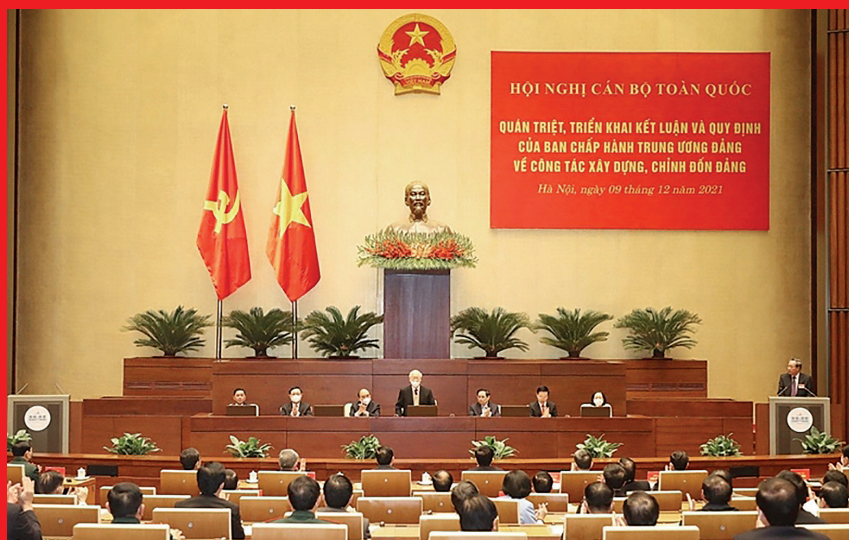
Tổng Bí thư Nguyễn Phú Trọng chủ trì Hội nghị cán bộ toàn quốc quán triệt, triển khai kết luận và quy định của BCHTW Đảng về công tác xây dựng, chỉnh đốn Đảng, ngày 9/12/2021

Thực tế những năm qua cho thấy, các thế lực thù địch, phản động, các phần tử cơ hội chính trị, luôn tìm mọi cách chống phá nhằm xóa bỏ vai trò lãnh đạo của Đảng cộng sản Việt Nam, bằng các chiêu trò khác nhau như: Xuyên tạc, phủ nhận chủ nghĩa Mác Lênin, tư tưởng Hồ Chí Minh, đòi phi chính trị lực lượng vũ trang, chống phá quá trình đổi mới do Đảng ta khởi xướng và