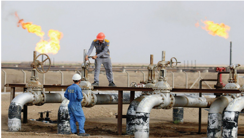
Giá dầu trên thị trường thế giới liên tục tăng mạnh ngay đầu năm 2022

nước sản xuất dầu lớn thứ hai thế giới và chủ yếu bán dầu thô cho các công ty lọc dầu Châu Âu. Nga cũng là nhà cung cấp khí tự nhiên lớn nhất cho khu vực này, chiếm khoảng 35% nguồn cung khí đốt. Tình hình căng thẳng Nga - Ukraine được cho là nguyên nhân mạnh mẽ nhất khiến giá dầu vượt ngưỡng 100 USD/thùng trong quý I năm 2022. Cùng với việc Tổng thống Hoa Kỳ Joe Biden tuyên bố cấm nhập khẩu dầu và năng lượng khác của Nga như một biện pháp trừng phạt, ngày 08/3/2022, giá dầu đã tăng hơn 30% kể từ ngày 24/2/2022.