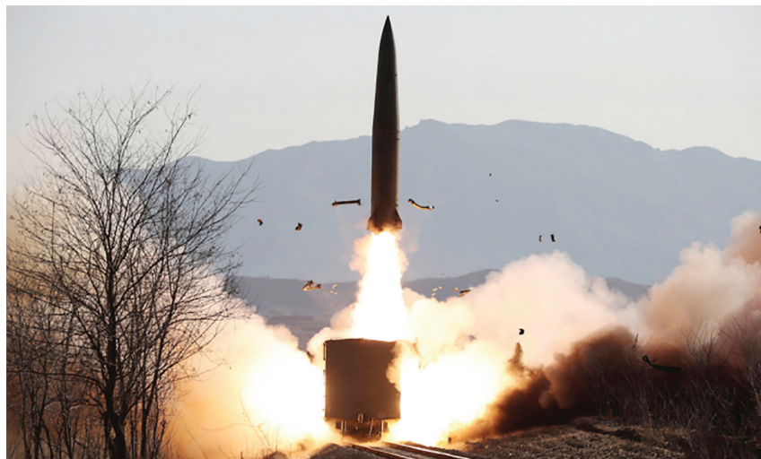
Tên lửa rời bệ phóng trên đường sắt trong cuộc diễn tập của quân đội Triều Tiên ngày 14/1

Hội đồng Bảo an trong khoảng một tuần về vụ phóng này. Tại cuộc họp, Tuyên bố chung của 11 quốc gia, bao gồm cả những nước không thuộc Hội đồng Bảo an cho rằng, Triều Tiên đã “phóng tên lửa đạn đạo” và đây là hành động vi phạm nhiều nghị quyết của Hội đồng Bảo an. Ngày 08/3/2022, Bộ Thống nhất Hàn Quốc đã kêu gọi Triều Tiên tuân thủ các thỏa thuận phi hạt nhân hóa Bán đảo Triều Tiên đã đạt được với cộng đồng quốc tế và Hàn Quốc.