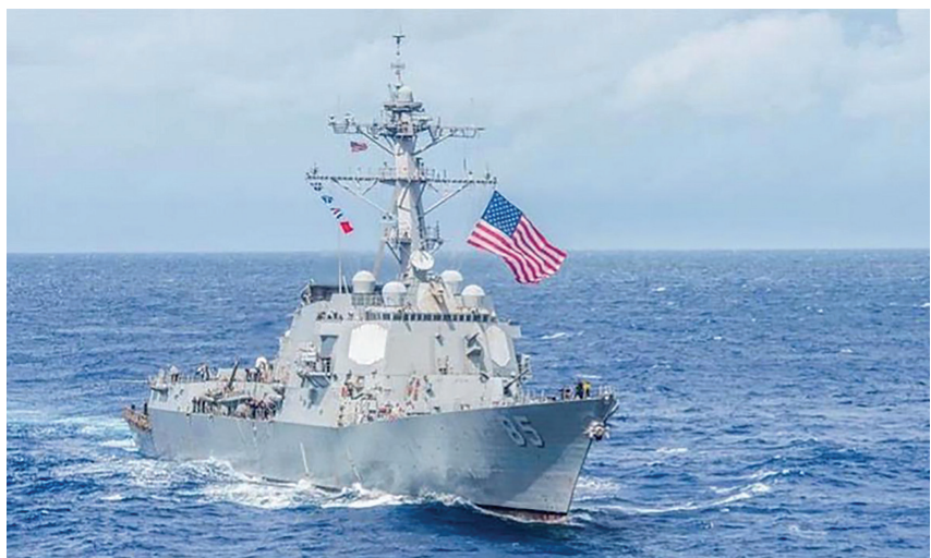
Theo chiến lược Ấn Độ Dương - Thái Bình Dương, Mỹ sẽ tăng cường hiện diện của lực lượng tuần duyên Mỹ ở khu vực

Thứ tư là an ninh. Các mục tiêu cụ thể: (1) Tăng cường khả năng răn đe tổng hợp; (2) Thắt chặt hợp tác và tăng cường khả năng phối hợp cùng với các đồng minh và đối tác; duy trì hòa bình và ổn định tại khu vực eo biển Đài Loan (Trung Quốc); (3) Đối mới để tác nghiệp hiệu quả trong môi trường mới với mối đe dọa