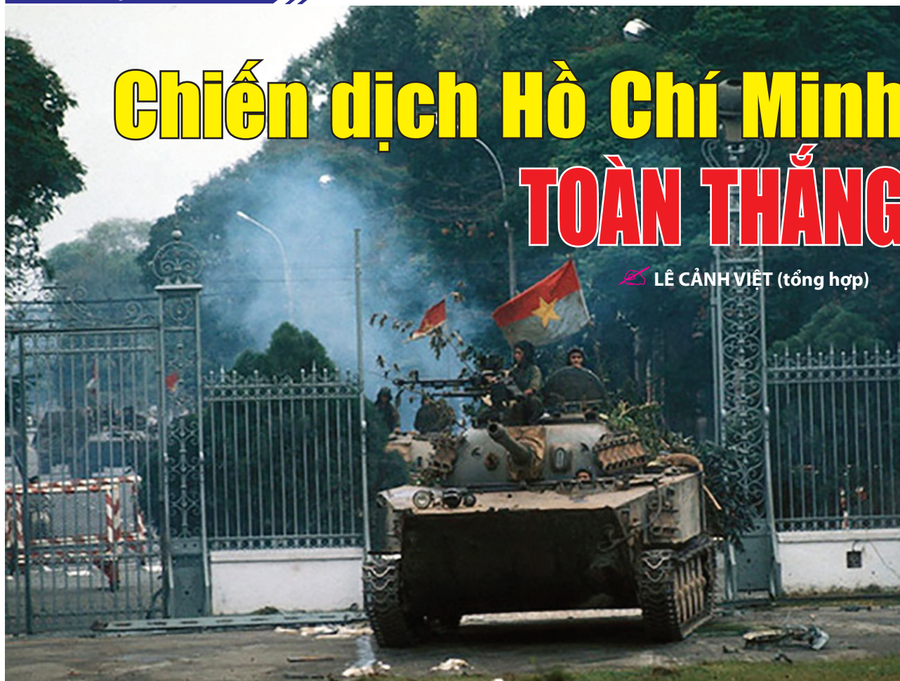
Xe tăng quân Giải phóng tiến vào Dinh Độc Lập

N gày 30/4/1975, Chiến dịch Hồ Chí Minh toàn thắng, chấm dứt 21 năm kháng chiến chống đế quốc Mỹ và chính quyền ngụy Sài Gòn. Để đi đến thắng lợi cuối cùng, dưới sự lãnh đạo của Đảng và Chủ tịch Hồ Chí Minh, quân và dân ta đã phải đối phó lần lượt với các kế hoạch, chiến lược của đế quốc Mỹ, chính quyền ngụy Sài Gòn và trải qua 5 giai đoạn: Giai đoạn 1: Từ tháng 7/1954 đến hết năm 1960, ta tập trung đấu tranh giữ gìn lực lượng, chuyển dần sang thế tiến công,