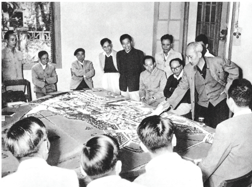
Chủ tịch Hồ Chí Minh xem mô hình quy hoạch xây dựng Thủ đô Hà Nội - ngày 16/11/1959

Tư tưởng, đạo đức, phong cách Hồ Chí Minh đã soi sáng con đường đổi mới của Đảng,