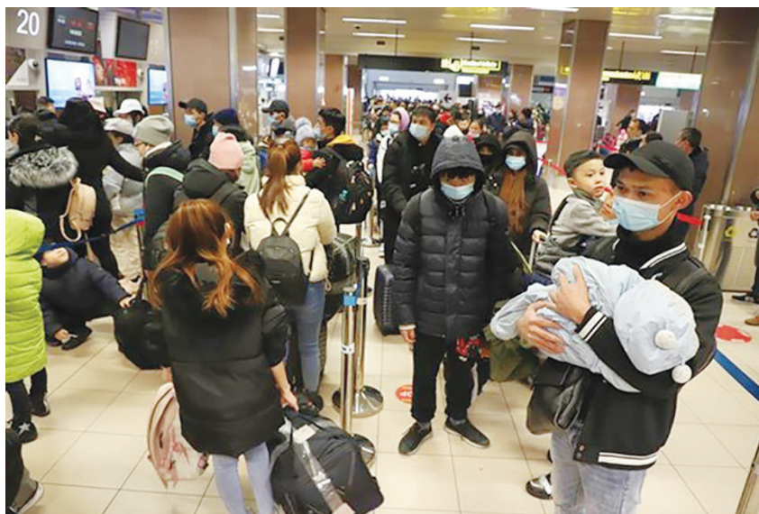
Bà con sơ tán từ Ukraine chuẩn bị làm thủ tục xuất cảnh tại sân bay thủ đô Bucharest của România để về nước, hôm 7/3/2022

Trước các diễn biến căng thẳng của tình hình Ukraina, Việt Nam đã nhiều lần nêu lên quan điểm của mình về vấn đề nhân đạo và nhân quyền. Phát biểu tại Phiên họp khẩn cấp của Đại hội đồng Liên Hợp quốc (ngày 02/3/2022), Đại sứ Đặng Hoàng Giang, Trưởng Phái đoàn thường trực Việt Nam tại Liên Hợp quốc khẳng định, lập