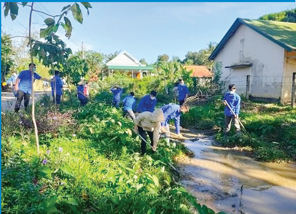
Ra quân bảo vệ môi trường là việc làm thường xuyên của ĐVTN huyện Đạ Tẻh

Sau 5 năm (2016 - 2021) triển khai thực hiện Chỉ thị 05 của Bộ Chính trị, Kế hoạch 12 của Ban Thường vụ Tỉnh uỷ, các cấp bộ Đoàn đã cụ thể hóa nội dung của học và làm theo Bác, đưa vào đời sống, sinh hoạt của mỗi cán bộ, đoàn viên, thanh thiếu nhi. Nhiều công trình, phần việc thanh niên làm theo lời Bác đã phát huy hiệu quả, tạo sự chuyển biến tích cực từ nhận thức đến hành động, có sự thay đổi rõ nét về ý thức rèn luyện đạo đức, lối sống, tinh thần trách nhiệm, ứng xử, thái