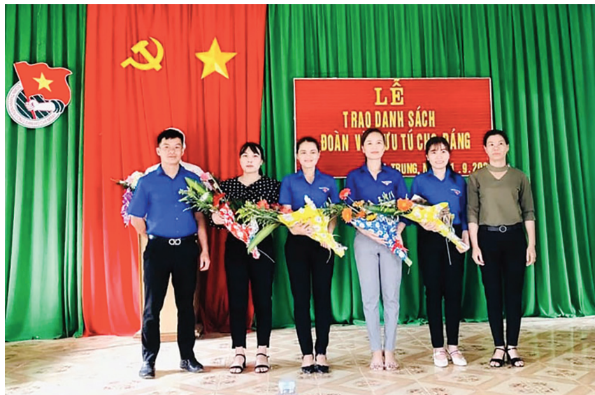
Đoàn Thanh niên các xã, thị trấn trên địa bàn huyện Di Linh chú trọng công tác giới thiệu đoàn viên ưu tú cho Đảng xem xét kết nạp

sinh hoạt đối với các chi bộ nông thôn, vùng đồng bào dân tộc thiểu số, những chi bộ yếu kém, chi bộ trong các doanh nghiệp, công ty cổ phần.