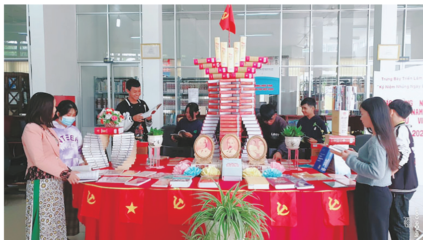
Giáo viên, học sinh tham quan, tìm hiểu sách trưng bày tại Thư viện huyện Đức Trọng năm 2021

Ngày Sách Việt Nam là sự kiện văn hóa quan trọng đối với những người yêu sách và cả cộng đồng xã hội. Việc lấy ngày 21/4 là ngày Sách Việt Nam có ý nghĩa rất quan trọng. Đây là thời điểm ra mắt cuốn sách “Đường Kách mệnh” của Chủ tịch Hồ Chí Minh - tác phẩm đầu tiên bằng tiếng Việt được in bởi những người thợ in Việt Nam. Chủ tịch Hồ Chí Minh là một tác giả lớn, một Danh nhân văn hóa, các tác phẩm của Người có giá trị không chỉ đối với người dân Việt Nam mà còn được bạn bè quốc tế đón nhận. Việc chọn ngày Sách Việt Nam gắn với một tác phẩm nổi tiếng của Người sẽ có ý nghĩa văn hóa sâu sắc. Bên cạnh đó, tháng 4 còn là thời điểm diễn ra Ngày sách và Bản