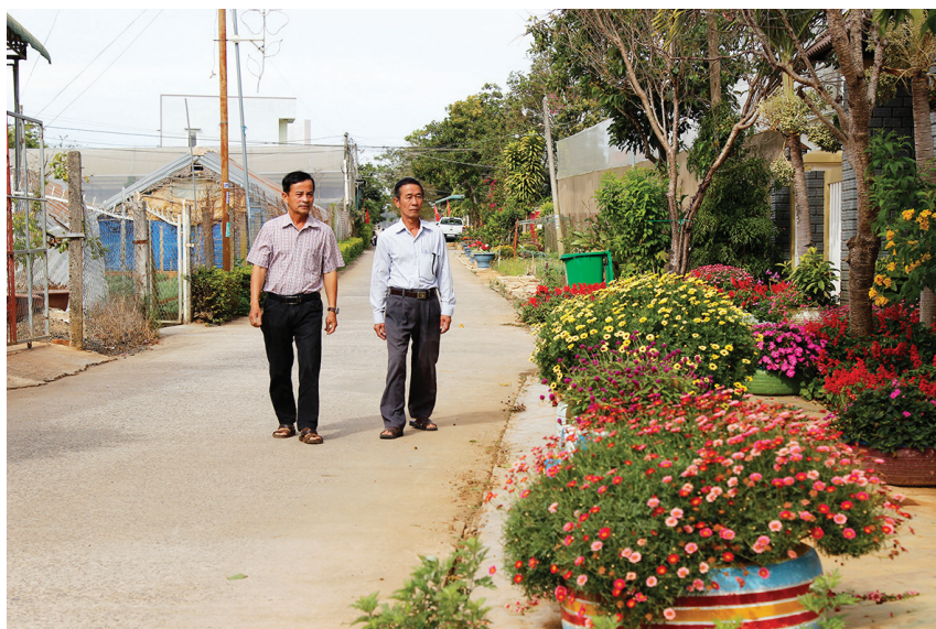
Đồng chí Bí thư Chi bộ và đồng chí Tổ trưởng TDP kiểm tra đường hoa

Nhờ hệ thống Camera an ninh đã được lắp đặt trong các cụm dân cư, trong những năm