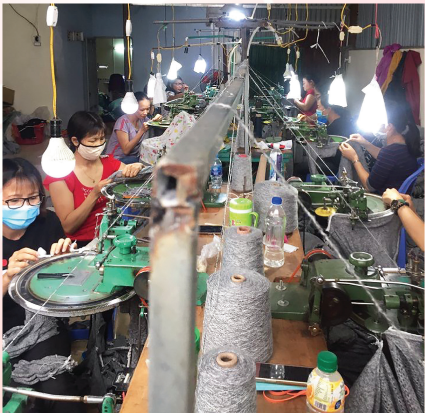
Dây chuyền sản xuất tại HTX đan len Quý Anh

có hoàn cảnh khó khăn, gặp trở ngại từ công việc gia đình nên không thể đi làm công nhân tại các công ty lớn và ở những địa phương xa được. Với quyết