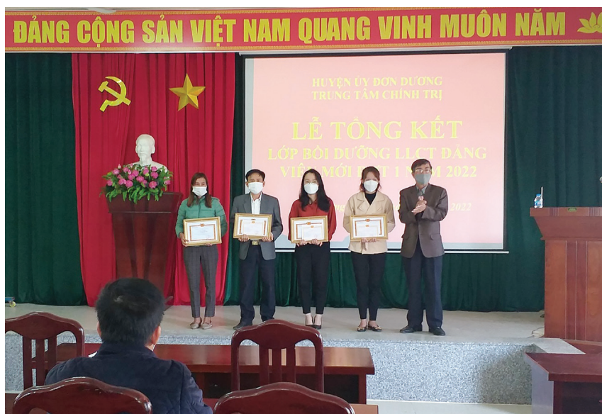
Lễ tổng kết lớp bồi dưỡng đảng viên mới huyện Đơn Dương năm 2022

Đồng thời, Ban Thường vụ Huyện ủy luôn quán triệt nhiệm vụ trọng tâm của công