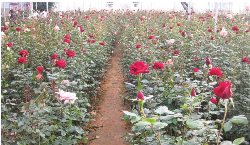
Hoa hồng Lang Biang được trồng trong các nhà kính công nghệ cao.

Đà Lạt trước nay là địa phương dẫn đầu cả nước về sản xuất nông nghiệp công nghệ cao (NNCNC). Song, có ý kiến cho rằng, những năm gần đây, NNCNC “dịch chuyển” về huyện Lạc Dương; bởi đất đai, khí hậu khá tương đồng Đà Lạt nên rất phù hợp với các loại cây công nghiệp. Nhiều doanh nghiệp trong nước và nước ngoài đã đầu tư vào Lạc Dương để phát triển NNCNC. Đặc biệt, nông dân bản địa khá nhạy bén với phương thức sản xuất mới, có “tầm nhìn” xa và dự đoán được nhu cầu thị trường nên đã mạnh dạn thay đổi cơ cấu cây