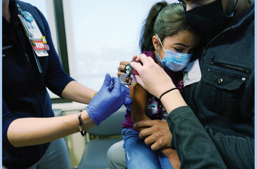
Một bé gái 5 tuổi được tiêm vaccine tại Bệnh viện Trẻ em ở Washington-Mỹ ngày 3/11/2021

Đặc biệt, ngày 05/02/2022 Chính phủ ban hành Nghị quyết số 14/NQ-CP về việc mua vaccine phòng Covid -19 của Pfizer cho trẻ em từ 5 đến dưới 12 tuổi. Cụ thể, Chính phủ quyết nghị đồng ý việc Thủ tướng Chính phủ cho phép áp dụng hình thức lựa chọn nhà thầu trong trường hợp đặc biệt quy định tại Điều 26 Luật đấu thầu đối với việc mua 21,9 triệu liều vắc xin phòng Covid -19 của Pfizer cho trẻ em