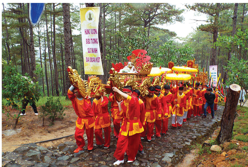
Đền thờ Âu Lạc trên núi Phượng Hoàng - Khu du lịch thác Prenz là nơi người dân Lâm Đồng hướng về Quốc tổ

Theo truyền thống từ thời nhà Đinh, Tiền Lê, nhà Lý, nhà Trần rồi đến nhà Hậu Lê và các