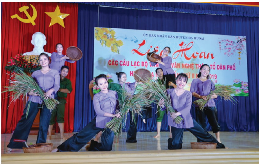
Một tiết mục văn nghệ tại Liên hoan các Câu lạc bộ Văn hóa văn nghệ huyện Đạ Huoai.

Thực hiện Nghị quyết 33-NQ/TW, ngày 9/6/2014 của Ban Chấp hành Trung ương Đảng về “Xây dựng và phát triển văn hóa, con người Việt Nam đáp ứng yêu cầu phát triển bền vững đất nước”, gắn với Chương trình hành động số 89-CTr/TU của Tỉnh ủy Lâm Đồng, Huyện ủy Đạ Huoai chỉ đạo UBND huyện xây dựng Đề án về bảo tồn và phát huy Di sản văn hóa Cổng chiêng