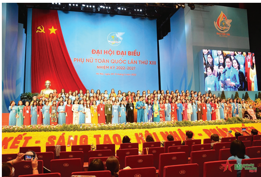
Ban chấp hành Hội Liên hiệp Phụ nữ Việt Nam khóa XIII gồm 155 đồng chí

Thứ hai, công tác nhân sự được tiến hành kỹ lưỡng, chặt chẽ, dân chủ, khách quan, công tâm. Đại hội đã bầu ra Ban Chấp