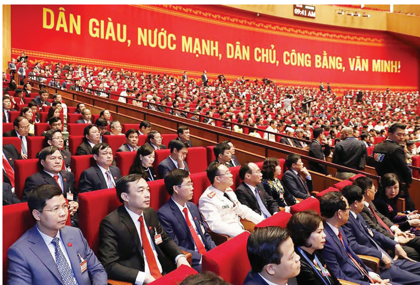
Các đại biểu dự Đại hội Đại biểu toàn quốc lần thứ XIII của Đảng

Tuy nhiên, Ban Tổ chức Trung ương nêu rõ cán bộ được quy hoạch “chưa nhất thiết phải đáp ứng ngay” tất cả tiêu chuẩn: kinh qua chức vụ lãnh đạo, quản lý cấp dưới, trình độ quản lý Nhà nước. Ví dụ, đối với quy hoạch chức danh thứ trưởng, tại thời điểm xem xét, cán bộ không nhất thiết đáp ứng đầy đủ tiêu chuẩn như đã kinh qua