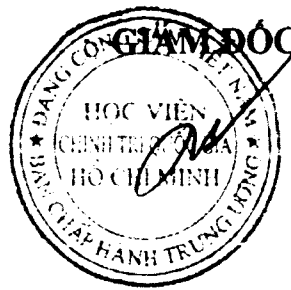
Nguyễn Xuân Thắng