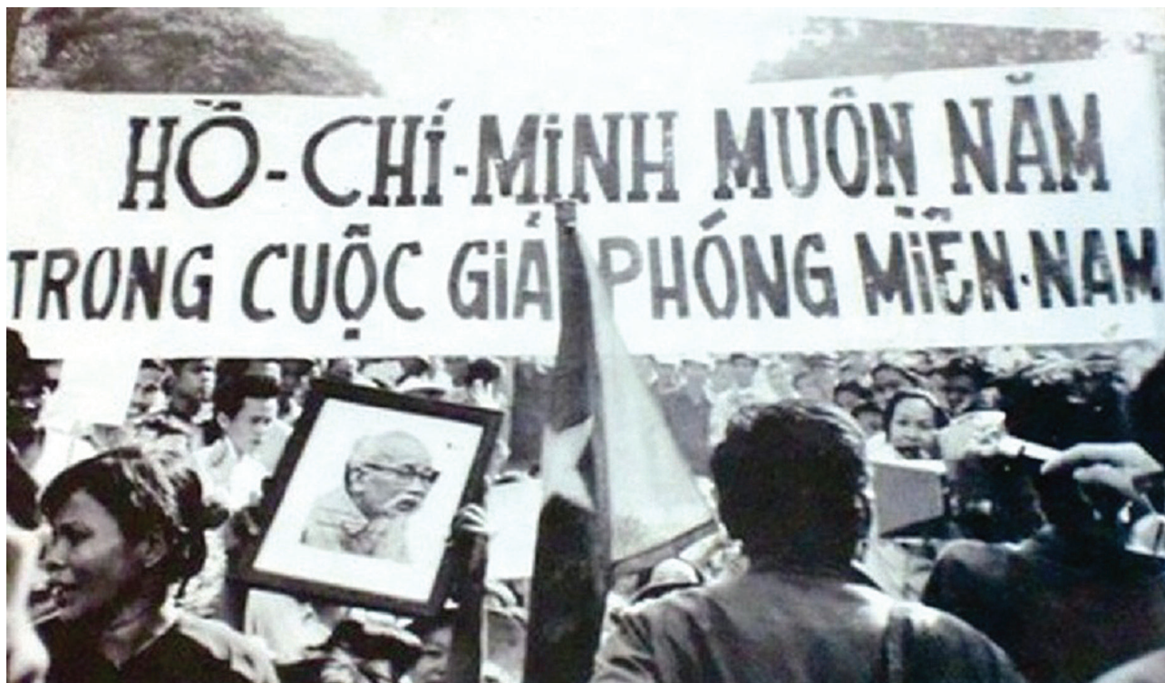
Như có Bác Hồ trong ngày vui Đại thắng.

Đ ại thắng mùa Xuân 1975 trở thành biểu tượng cao đẹp của chủ nghĩa anh hùng cách mạng, lòng yêu nước, bản lĩnh và trí tuệ Việt Nam trong thời đại Hồ Chí Minh. Trong dịp này, chúng ta bày tỏ niềm tự hào về dân tộc Việt Nam ta, một dân tộc anh hùng; về Chủ tịch Hồ Chí Minh vĩ đại; về Đảng Cộng sản Việt Nam quang vinh đã và đang chèo lái con thuyền cách mạng Việt Nam qua bao ghềnh thác.