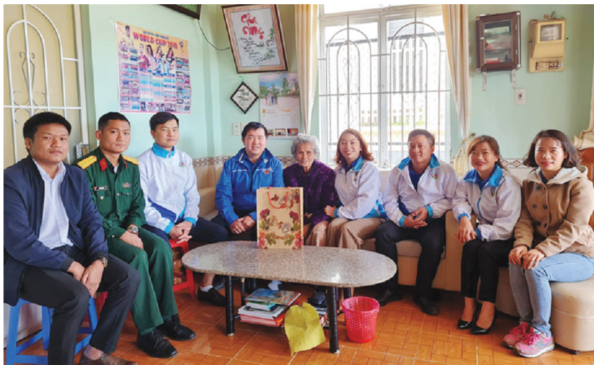
Thăm, tặng quà Mẹ Việt Nam Anh hùng. Ảnh: KT