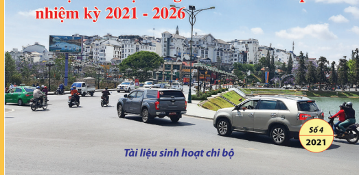
Tài liệu sinh hoạt chi bộ

Bầu cử đại biểu Quốc hội khóa XV và đại biểu Hội đồng nhân dân các cấp nhiệm kỳ 2021 - 2026