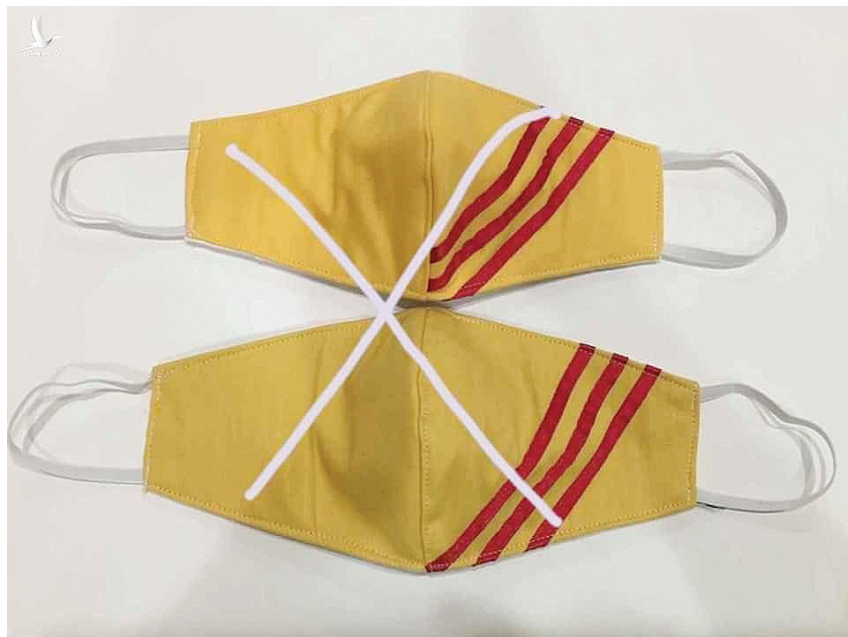
Lợi dụng dịch Covid-19, tuyên truyền về chế độ đã sụp đổ từ 46 năm trước.