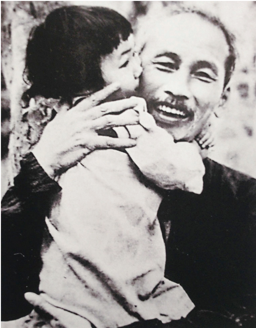
Bác Hồ với thiếu niên, nhi đồng.

1. “Trí tuệ và sáng kiến của quần chúng là vô cùng tận”.