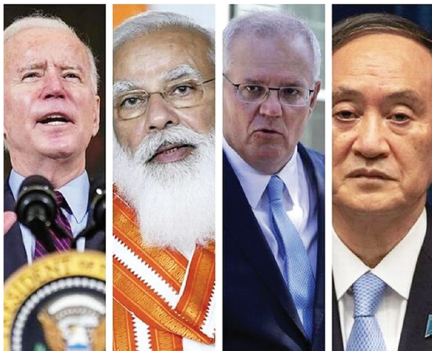
Người đứng đầu chính phủ của 4 quốc gia “Nhóm Bộ Tứ” trong Hội nghị thượng đỉnh ngày 12/3/2021.

như Tầm nhìn ASEAN về Ấn Độ Dương - Thái Bình Dương.