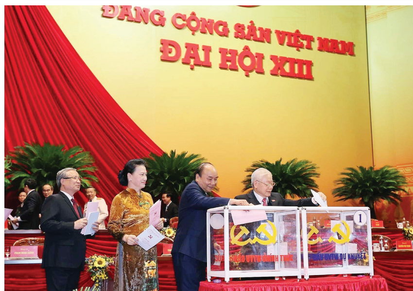
Đại biểu bỏ phiếu bầu Ban Chấp hành Trung ương Đảng khóa XIII.

Đại hội đại biểu toàn quốc lần thứ XIII của Đảng họp từ ngày 25/01/2021 đến 01/02/2021. Đây là sự kiện chính trị trọng đại của Đảng, đất nước và dân tộc ta, có ý nghĩa đặc biệt quan trọng trong quá trình tiếp tục đẩy mạnh toàn diện, đồng bộ công cuộc đổi mới của đất nước. Phát biểu Bế mạc Đại hội, Tổng Bí thư, Chủ tịch nước Nguyễn Phú Trọng nhấn mạnh: “Đại hội đã thành công rất tốt đẹp...”. BBT Bản tin trích những nội dung quan trọng kết quả của Đại hội.