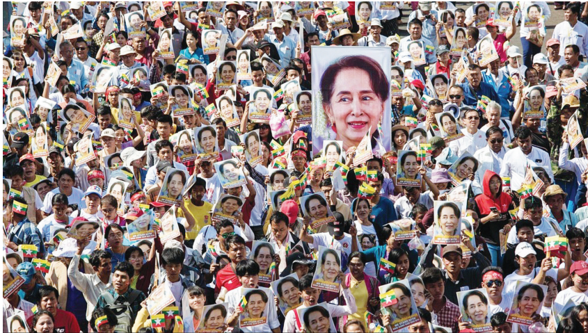
Chính biến diễn ra tại Myanmar khiến cộng đồng quốc tế quan ngại.

vong tiếp tục gia tăng tại Mi-an-ma trong những ngày gần đây. Việt Nam kêu gọi các bên liên quan hết sức kiềm chế, không sử dụng vũ lực, thông qua đối thoại hòa bình để giải quyết bất đồng; mong muốn Mi-an-ma sớm ổn định, vì lợi ích của nhân dân Mi-an-ma, vì hòa bình, ổn định ở khu vực. Việt Nam chia sẻ lập trường chung của ASEAN đã được nêu tại Tuyên bố của Chủ tịch ASEAN về diễn biến ở CHLB Mi-an-ma ngày 01/02/2021, cũng như trong tuyên bố Chủ tịch ASEAN về kết quả của Hội nghị không chính thức Bộ trưởng Ngoại giao ASEAN ngày 02/3/2021, trong đó nhấn mạnh đến việc tuân thủ Hiến chương ASEAN; ủng hộ đối thoại, hòa giải và mong muốn tình hình tại Mi-an-ma sớm trở lại bình thường phù hợp với ý chí và lợi ích của nhân dân Mi-an-ma để xây dựng và phát triển đất nước, vì hòa bình, ổn định, hợp tác ở khu vực và tiếp tục đóng góp cho tiến trình xây dựng Cộng đồng ASEAN...”.