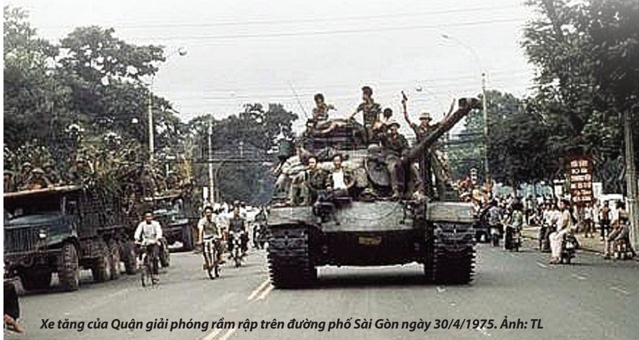
Xe tăng của Quân giải phóng rầm rập trên đường phố Sài Gòn ngày 30/4/1975.