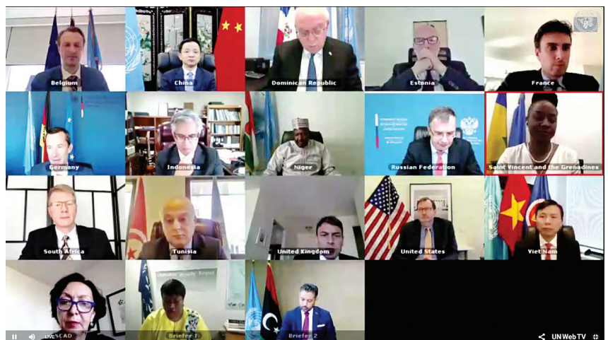
Hội đồng Bảo an Liên Hợp quốc hoan nghênh các tiến triển tại Libya.