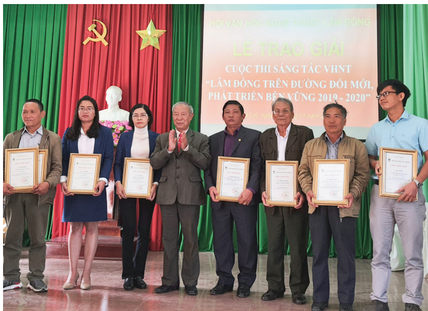
Trao giải cho các tác giả trong Cuộc thi “Lâm Đồng trên đường đổi mới, phát triển bền vững”.

Năm 2020, do đại dịch Covid-19 diễn biến phức tạp, Hội VHNT tạm dừng một số hoạt động lớn như: Ngày thơ Việt Nam, Ngày truyền thống Nhiếp ảnh Việt Nam, Ngày Âm nhạc Việt Nam...Tuy nhiên, Hội VHNT Lâm Đồng đã có nhiều nỗ lực triển khai các hoạt động cho hội viên, văn nghệ sĩ, cụ thể: Hội đã tổ chức 07 Trại