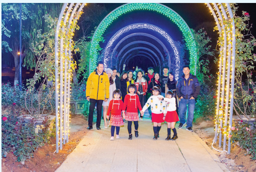
Du lịch ban đêm đã được tổ chức tại Vườn hoa TP. Đà Lạt.