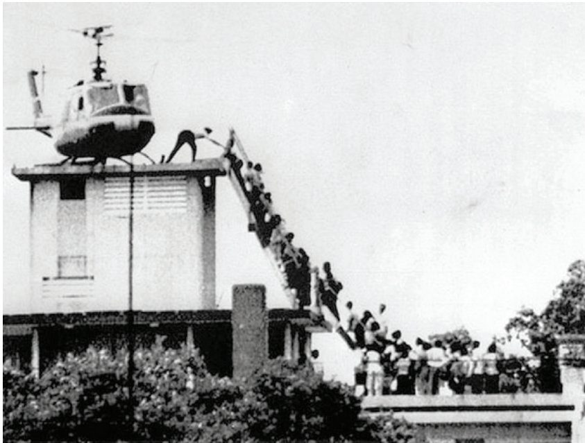
Cảnh tượng quan chức VNCH bu bám trực thăng để chạy ra nước ngoài.