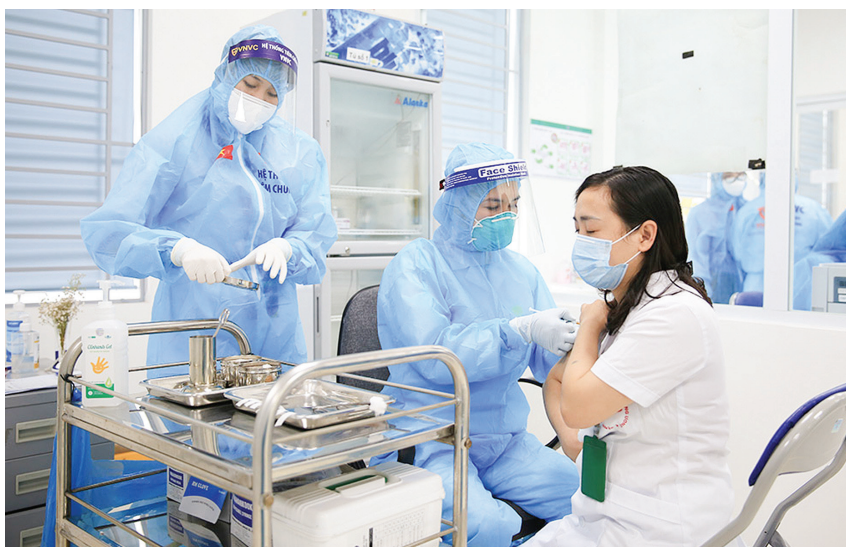
Tiêm vắc xin Covid-19 cho lực lượng tuyến đầu phòng, chống dịch.

Ngay từ khi phát hiện dịch bệnh, Việt Nam đã có những quyết sách chỉ đạo quyết liệt từ Trung ương đến địa phương; sự quyết tâm và nỗ lực lớn của Trung ương Đảng, Chính phủ, các bộ, ban, ngành, các địa phương và toàn thể Nhân dân