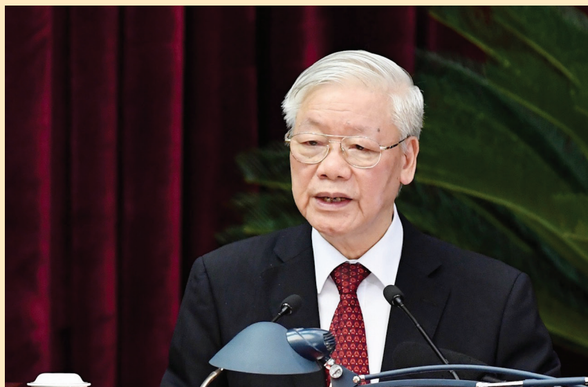
Tổng Bí thư, Chủ tịch nước Nguyễn Phú Trọng phát biểu khẳng định tiềm lực, vị thế của Việt Nam tại Đại hội XIII của Đảng.

// Trước ngày diễn ra Đại hội toàn quốc lần thứ XIII của Đảng, các thế lực thù địch phỉ báng vu vơ về vấn đề nhân sự của Đảng rồi lan truyền trên mạng xã hội những luận điệu chống Đảng. Khi BCHTW Đảng họp bàn về nhân sự, chúng lại đoán già, đoán non, tung ra những lời lẽ xuyên tạc nhằm hạ bệ Tổng Bí thư, Chủ tịch nước Nguyễn Phú Trọng. Đến khi Tổng Bí thư Nguyễn Phú Trọng tiếp tục được đại hội bầu vào BCHTW Đảng khóa XIII, được Bộ Chính trị tín nhiệm bầu làm Tổng Bí thư Đảng Cộng sản Việt Nam nhiệm kỳ 2021-2025 với số phiếu tuyệt đối thì chúng lồng lộn chống Đảng với thái độ hằn học, điên cuồng. //