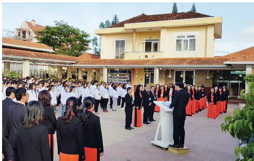
Một buổi chào cờ và sinh hoạt chính trị sáng thứ 2 tại Trường CĐYT Lâm Đồng.