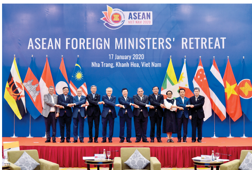
Việt Nam Chủ tịch ASEAN năm 2020.