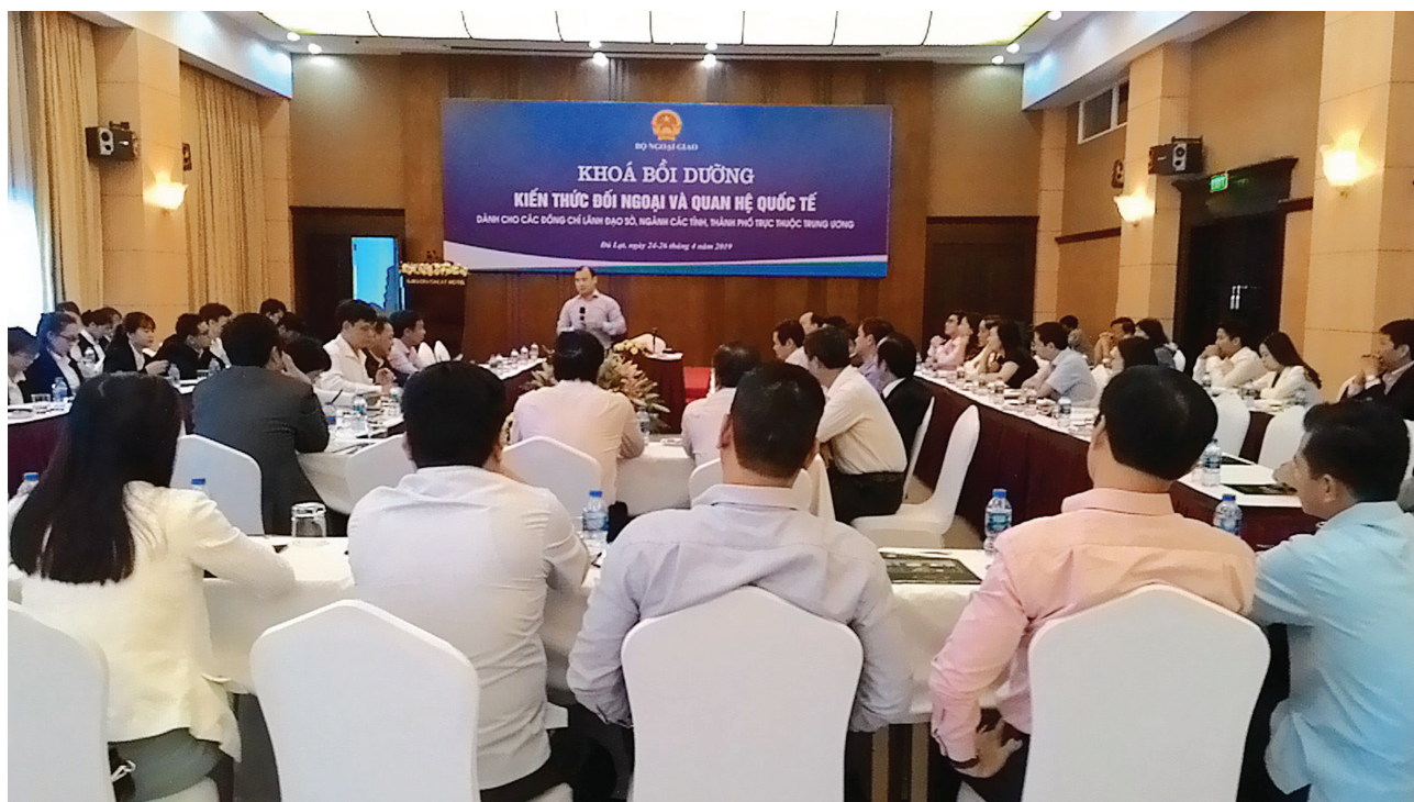
Bộ Ngoại giao tập huấn kiến thức đối ngoại cho cán bộ các tỉnh, thành tại Đà Lạt.