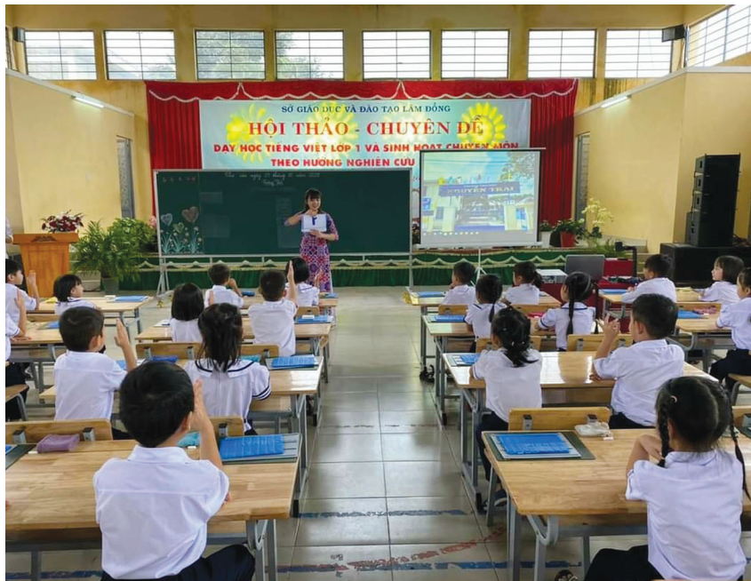
Chuyên đề dạy học tiếng Việt Lớp 1 và sinh hoạt chuyên môn theo hướng nghiên cứu bài học tại Trường Tiểu học Đoàn Thị Điểm - Đà Lạt

Do thời gian đầu cả giáo viên và học sinh lớp 1 còn bỡ ngỡ, ngành giáo dục đã tổ chức các chuyên đề tại các cụm chuyên môn nhằm tháo gỡ khó khăn và tư vấn, hướng dẫn thực hiện. Ngày 23/10/2020, Ngành giáo dục đã tổ chức Hội thảo Chuyên đề “Dạy học Tiếng Việt lớp 1 và sinh hoạt chuyên môn theo hướng nghiên cứu bài học” tại Trường Tiểu học Đoàn Thị Điểm - Đà Lạt; ngày 30/10/2020, được Phòng GD-ĐT TP.Đà Lạt chỉ định, Trường Tiểu học Thực nghiệm Lê Quý Đôn tổ chức Chuyên đề “Dạy học theo định hướng phát triển năng lực, phẩm chất cho học sinh lớp 1, qua việc hình thành số đếm trong phạm vi 10”. Qua kiểm tra học kỳ (HK)1, đối với