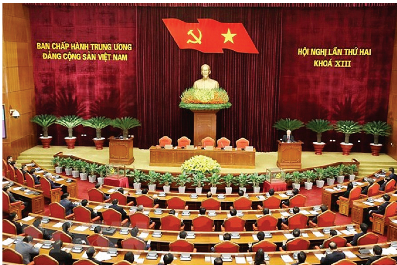
Toàn cảnh Hội nghị Trung ương 2 Khóa XIII.